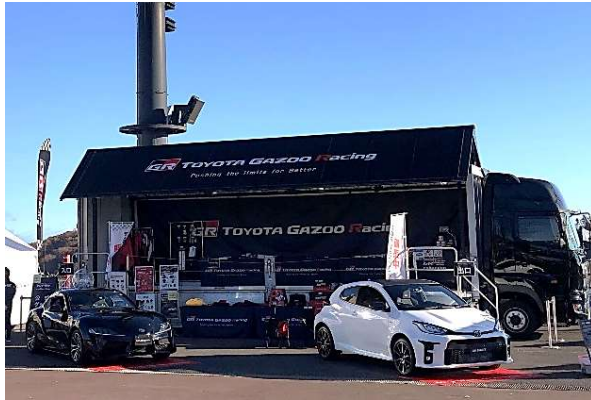
TOYOTA GAZOO Racing