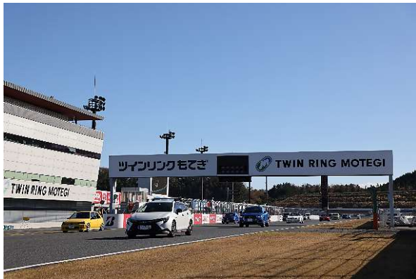
みんなでマイカーパレード