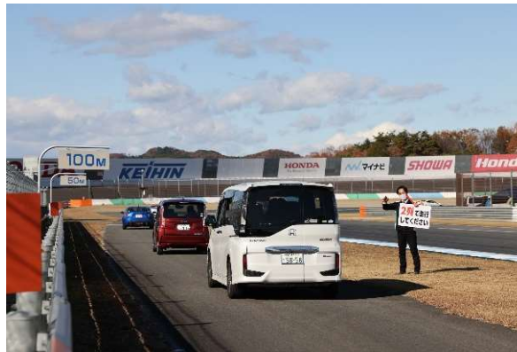
みんなでマイカーパレード