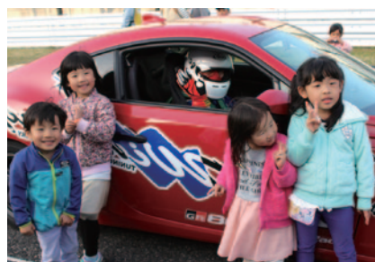
中学生までのお子さまと同伴者の方に、86/BRZクラブマンBレース直前のスターティンググリッドの臨場感を楽しんでいただきました。