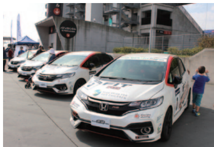
Honda Sports & Eco Program FIT Ecoチャレンジに使用されるマシンをGPスクエアに展示、中学生以下の方にはコックピット体験も楽しみいただきました。