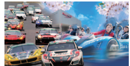
③出稿用ビジュアル