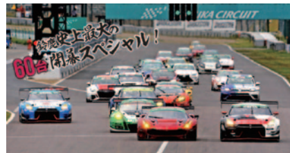
①・②出稿用ビジュアル

①2月 2日(金)～ 6日(火) ②3月15日(木)～19日(月) ③3月23日(金)～30日(金)の三回実施 合計表示回数 463,374回 合計クリック数 8,298回