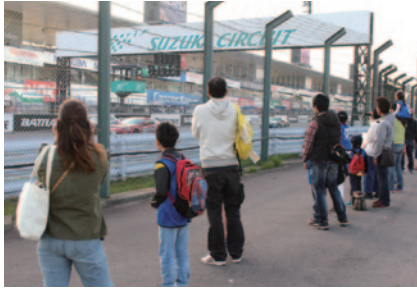
抽選で選ばれた親子に、86/BRZクラブマンBレースのスタートをコース近くの特別エリアからご覧いただきました。