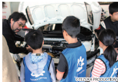
小学生以下のお子さまと同伴者が各チームのピットを訪問、ドライバーの活躍を支えるピットクルーによるマシン解説などをご体験いただきました。