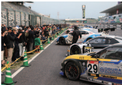
S耐決勝後ストレートを開放、コース上に設置されたパルクフェルメ(車両保管場所)の間近までお入りいただき、戦いを終えたばかりのマシンをご覧いただきました。