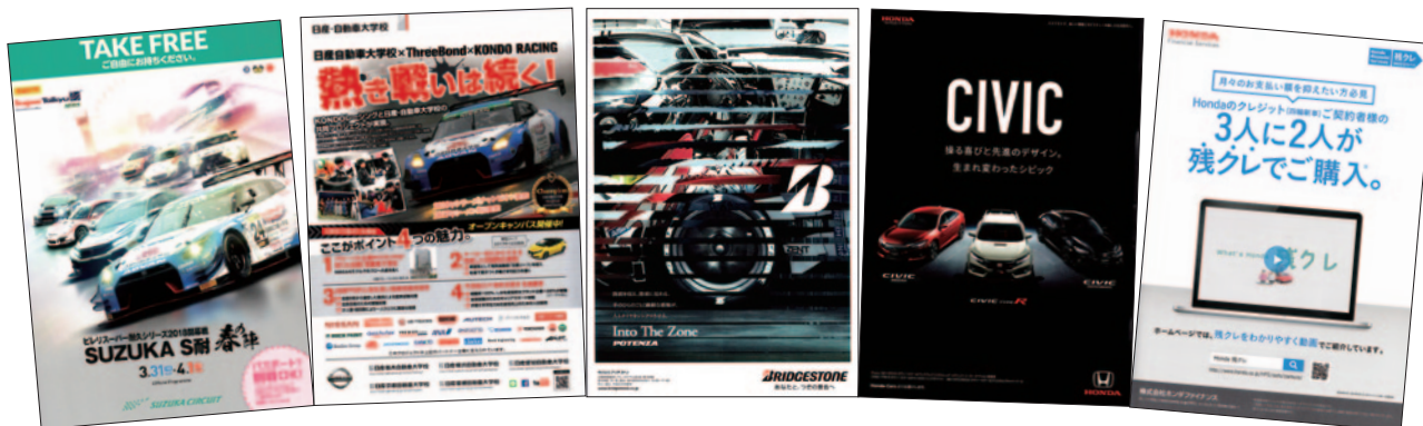
A4 カラー 24p 無料配布いたしました。