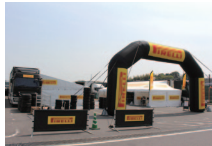
今シーズンからS耐の公式タイヤサプライヤーとなったピレリのタイヤサービスがパドックに開設されました。