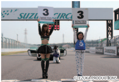
コチラレーシングファンクラブ会員の女の子の中から抽選でレース開始を告げるカウントダウンボードを掲げていただきました。