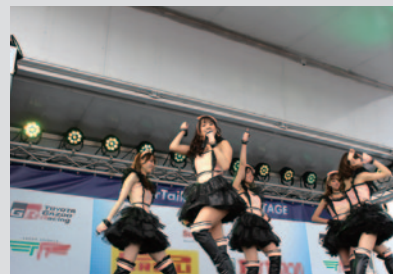
S耐イメージガール、D's station フレッシュエンジェルズのライブステージ。