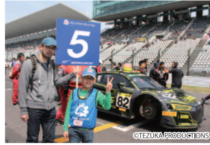
コチラレーシングファンクラブ会員の中から抽選で選ばれた親子に、S耐スターティンググリッドでマシンを迎えていただきました。