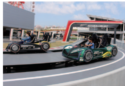
大会期間は春休み中とあって、ゆうえんちも多くのお客さまで大にぎわい。3月にデビューした新アトラクション「DUEL GP」が人気を集めていました。