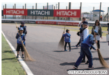
コチラレーシングファンクラブ会員の皆さまを対象に走行直後のレーシングコースで、コース清掃のオフィシャル活動をご体験いただきました。