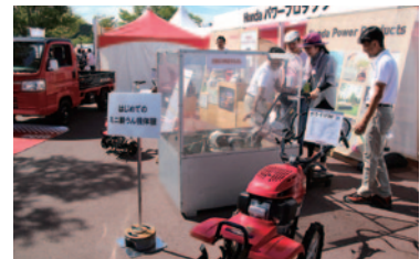
耕うん機、除雪機、発電機など、生活を豊かにするさまざまなジャンル製品が紹介された「Honda/パワープロダクツ」ブース。