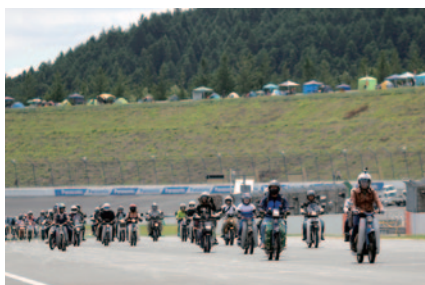
今年生誕60周年を迎えたHonda スーパーカブ。約180台が集い、レーシングコースをパレードしました(19日)。