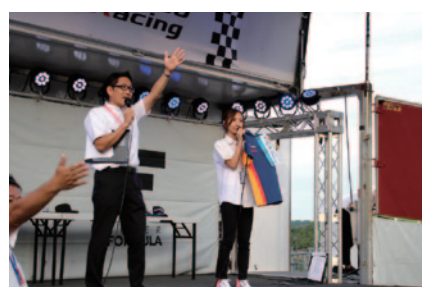
全スケジュール終了後に行われたチャリティオークション。売上金は平成30年7月豪雨被災者への義援金として役立てられます(19日 スーパーフォーミュラオフィシャルステージ)。

PICK UP 3 Honda Collection Hallでは、大会期間を通じて多彩なイベントが開催されました。