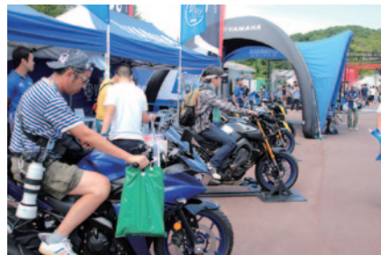
ニューモデルの搭乗体験などが行われたYAMAHAブース。