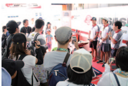
MuSASHi RT HARC-PRO. Honda(写真)、TEAM MUGENのピットを訪問、選手との交流やマシンを間近にご覧いただいた「チームPIT訪問ツアー」(18日)。