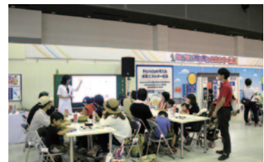
新時代のエネルギーとして注目されている水素について、見て・ふれて・学んでいただいた「なげなに! ワクワク、エネルギー教室」。