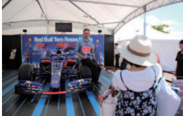
「Red Bull Toro Rosso Honda STR13 prototype」展示とフォトコーナー。

Hondaの二輪・四輪・パワープロダクツを通して、「見て、遊んで、体感する」ことを目的としたファンの皆さまへの感謝イベント「Enjoy Honda 2018」が場内一円を舞台に多彩に展開されました。