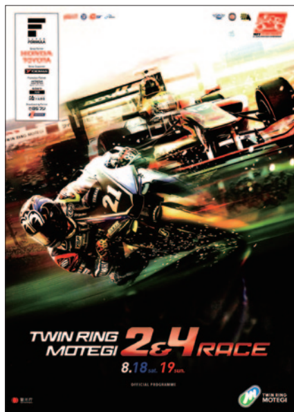
大会公式プログラム