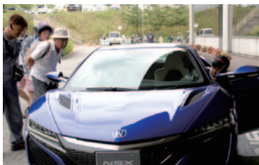
話題のHonda NSXの助手席でそのパフォーマンスをご体験いただいた「NSX同乗体験」。