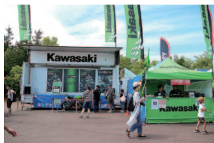
JSB1000マシン「ZX-10RR」が展示されたKawasakiブース。