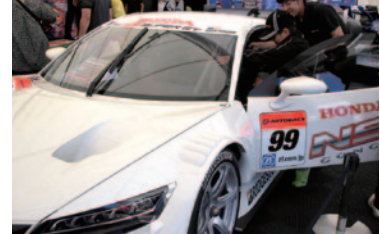
本物のSUPER GT500マシンに搭乗できる「Honda NSX CONCEPT GTコックピット体験」。