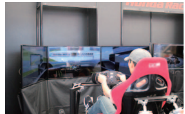
スーパーフォーミュラマシン「SF14」のツインリンクもてぎでのリアルな走りをご体験いただいた「レーシングシミュレーター」。