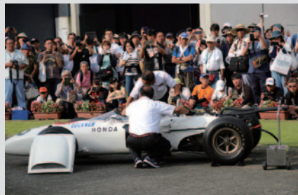
Honda F1初優勝を遂げた「Honda RA272」のV12エンジンサウンドをお楽しみいただいた「よみがえるホンダサウンド RA272エンジン始動パフォーマンス」(19日)。