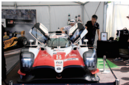
WEC (世界耐久選手権) で活躍する「TS050 Hybrid」のコックピット体験などが行われたTOYOTA GAZOO Racingブース。