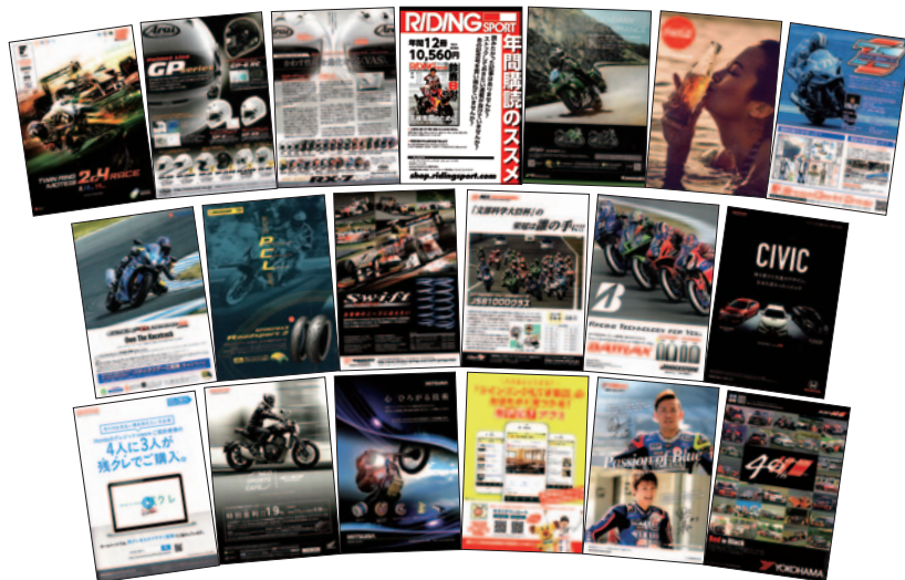
A4 カラー 68p 12,000部発行

株式会社アライヘルメット 株式会社オフィスとらくしよん 株式会社カワサキモータースジャパン コカ・コーラ ボトラーズジャパン株式会社 昭和電機株式会社 株式会社スズキ二輪 住友ゴム工業株式会社 株式会社東京発条製作所 一般財団法人日本モーターサイクルスポーツ協会 (MFJ) 株式会社ブリヂストン 本田技研工業株式会社 株式会社ホンダファイナンス 株式会社ホンダモーターサイクルジャパン 株式会社ミツバ ヤマゼンコミュニケーションズ株式会社 ヤマハ発動機販売株式会社 横浜ゴム株式会社