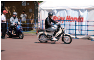
初めての方にもインストラクターの指導で原付バイクの楽しさを実感いただいた「原付バイク体験試乗会」。