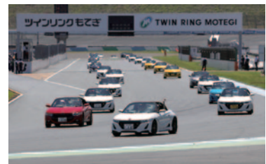
約141台のHonda S660がレーシングコースをパレードした「S660 Owner's Parade 2018」(18日)。