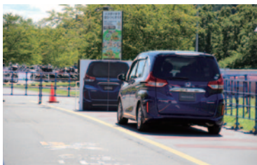
Hondaの安全支援システム「Honda SENSING」搭載車両に同乗いただき、衝突軽減ブレーキ（CMBS）をご体験いただいた「Honda SENSING同乗体験」。