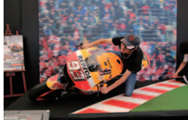
本物のMotoGP™マシンの60°のバンク角を体験いただいた「なりきり! MotoGP™ライダー」。