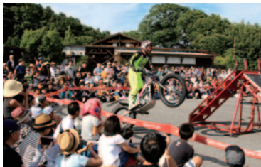
究極のライディングテクニックをお楽しみいただいた「トライアルバイクショー」。