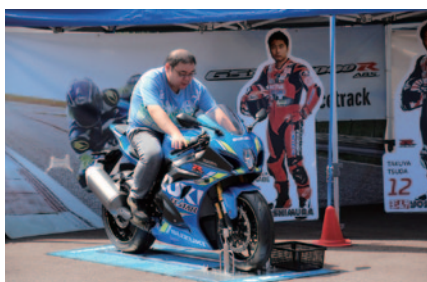
ニューモデルの搭乗体験などが行われたSUZUKIブース。