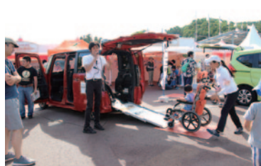
Hondaの福祉車両を展示・体験いただいた「Hondaの福祉への取り組み、福祉車両の体験」。