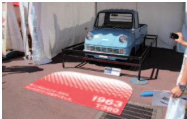
Honda初の4輪車「T360」生誕55周年 特別展示。