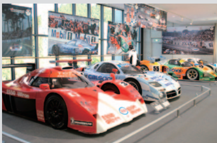
「ル・マン24時間」で表彰台を飾ったマツダ、トヨタ、日産、Hondaのマシンが一堂に会した特別展示「栄光のチェッカーフラッグ～ル・マン24時間レースに挑んだ日本車たち～」(9月12日(水)まで)。