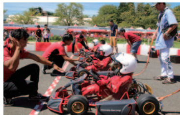
レーシングカートの楽しさをインストラクターの指導とともに体験いただいた「キッズカート体験」。