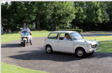
Honda Collection Hall所蔵車両のデモ走行「WEEKEND RUN」。「Honda N360」(手前)、「Honda Gold Wing」が走りを披露しました(18日…写真 19日)。

PICK UP 3 Honda Collection Hallでは、大会期間を通じて多彩なイベントが開催されました。