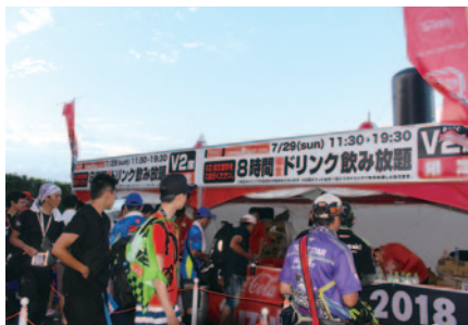
V2席のお客さまを対象に実施された決勝レース中のコカ・コーラ製品飲み放題サービス (29日)。