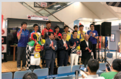
県内の5チームが登場、8耐に向けての思いを語りました。