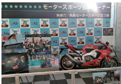
鈴鹿市役所1階市民ロビー「モータースポーツ振興コーナー」にはコグレッドに彩られた大会プロモーションバイクHonda CBR1000RRやF.C.C. TSR Honda Franceの「ル・マン24時間」優勝パネルなどが展示されました(4月25日(水)～ ※途中一部展示内容変更あり)。企画:NPO法人鈴鹿モータースポーツ友の会