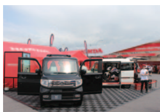
本田技研工業株式会社