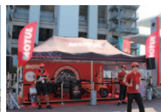
MOTUL(テクノイルジャパンK.K.)