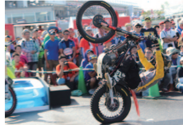
「BIKE! LIVE! パフォーマンス」トライアルパフォーマンス。バイクを手足のように操るスーパースキルに大きな拍手が。