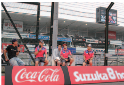
Red Bull Honda with 日本郵便のトークショー。