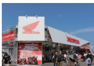
株式会社ホンダモーターサイクルジャパン