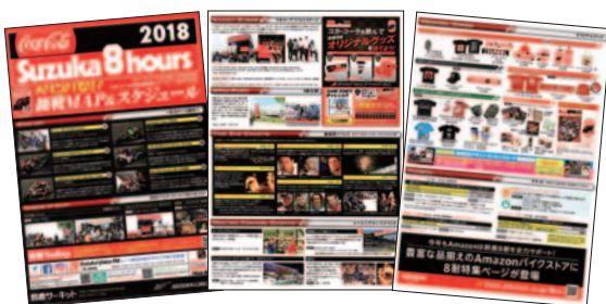
アマゾン コカ・コーラ