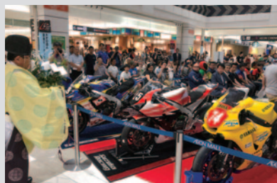
勝速日神社(白子本町)宮司による安全祈願。