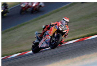
2位のRed Bull Honda with 日本郵便。パトリック・ジェイコブセンの走り。