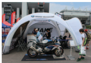
ビー・エム・ダブリュ株式会社