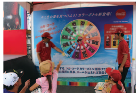
対象となるコカ・コーラ製品のラベルを3枚集めてチャレンジ、ステキな賞品をゲットしていただいた「コカ・コーラ「カラーボトル」ルーレットチャレンジ」(27、29日)。