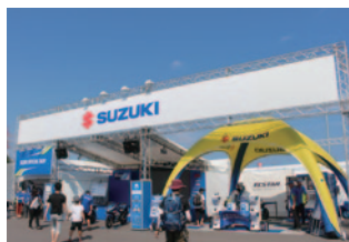
株式会社スズキ二輪