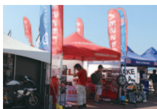
株式会社ベッセル