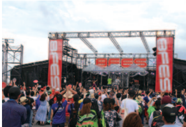
熱い盛り上がりみせたステージ

「BASE8耐」会場で開催された音楽イベント「8フェス」。2回目となる今回は、12組のアーティストのライブパフォーマンスを2日間たっぷりお楽しみいただきました。