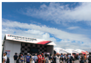
株式会社アリヂストーン