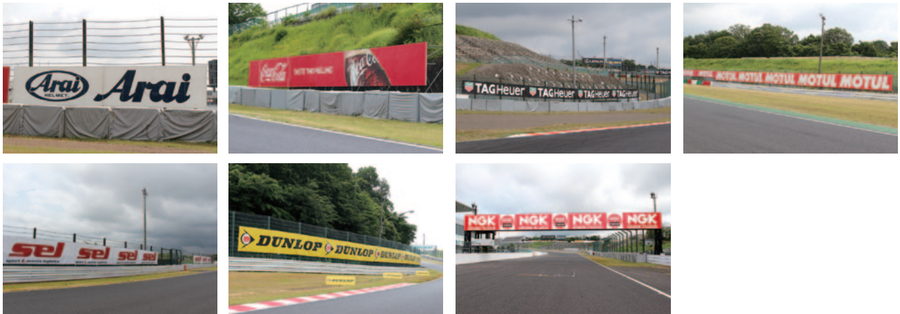
株式会社アライヘルメット SEL