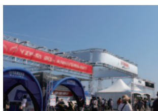
ヤマハ発動機販売株式会社