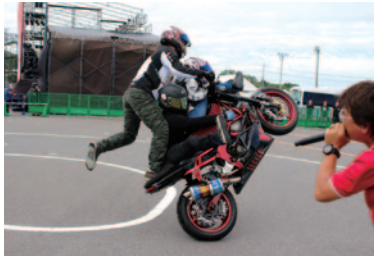
BIKE! LIVE! パフォーマンス]エクストリームバイクパフォーマンス。ビッグバイクからスーパーカブまで、車種を問わない驚愕のパフォーマンス。