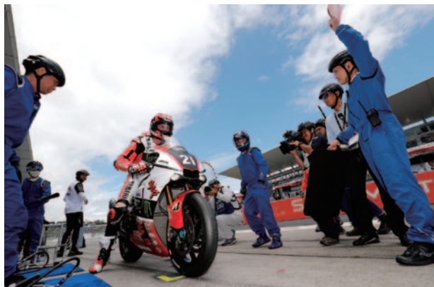
4連覇を果たしたYAMAHA FACTORY RACING TEAMのピット作業。

ウェット路面でのスタートとなった決勝レース。Kawasaki Team GREENのレオン・ハスラムとRed Bull Honda with 日本郵便の高橋巧が序盤のトップ争いを展開。スタートから約30分で路面はドライへ。各チームがタイヤ交換を終えた後は、Kawasaki Team GREENのジョナサン・レイとYAMAHA FACTORY RACING TEAMのマイケル・ファン・デル・マークによるバトルが場内をわかせました。レース中盤にかけては、セーフティーカーがたびたび介入する中、Kawasaki、YAMAHA、Hondaのトップチーム対決の構図が継続しましたが、ジョナサン・レイが惜しくも転倒。YAMAHA FACTORY RACING TEAMとRed Bull Honda with 日本郵便に絞られたトップ争いはYAMAHAが徐々にリードを広げ、4連覇の偉業を達成しました。また、F.C.C. TSR Honda Franceが、日本チームとして初の世界耐久選手権(EWC)チャンピオン獲得の快挙を達成しました。