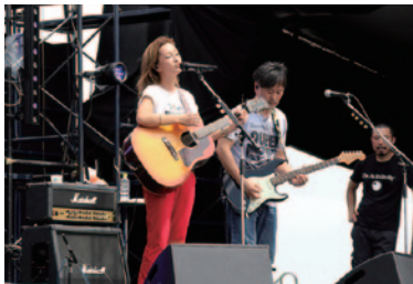
Do As Infinity