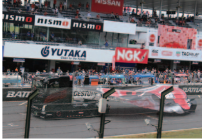
イベントロゴがあしらわれたビッグフラッグがトレーラーヘッドのけん引でコースを周回しました。

29日(日)朝、決勝レースに先立ち、オープニングセレモニーが華やかに開催されました。