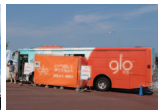
プリティッシュ・アメリカン・タバコ・ジャパン合同会社