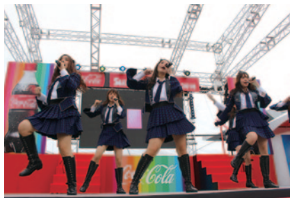
タイの人気アイドルグループ「BNK48」メンバーによるトークとミニライブ(29日)。