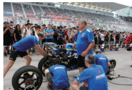
恒例のナイトピットワーク。各チームのピットワーク練習など決勝への期待が高まるひとときとなりました。