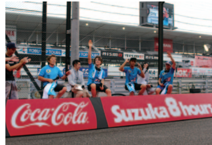
Team KAGAYAMA U.S.A.のトークショー。