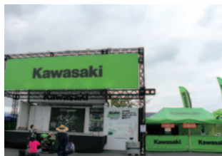
株式会社カワサキモータースジャパン