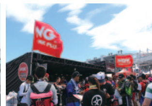
日本特殊陶業株式会社