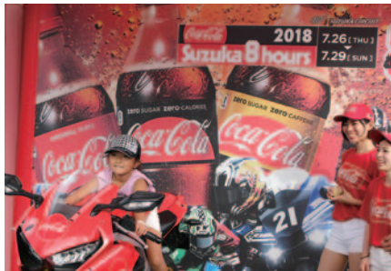
大会のプロモーションバイクHonda CBR1000RRの搭乗体験 (27、29日)。