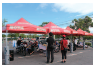
MOTUL(テクノイルジャパンK.K.) *P4駐車場でのユーザーサービス