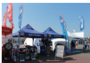
リキモトレーディング株式会社