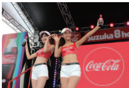
「コカ・コーラ」ガールによるフォトセッション(27、29日)。