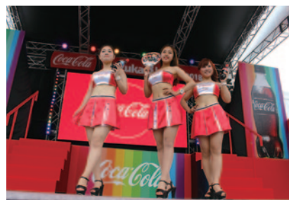
「コカ・コーラ」サーキットクイーンのトーク&フォトステージ(27、29日)。