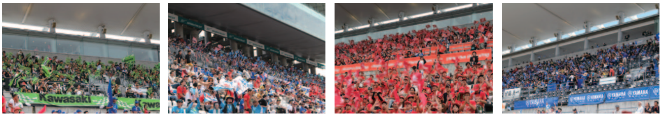
株式会社カワサキモータースジャパン スズキ株式会社 Team SuP Dream Honda応援席