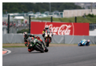
3位のKawasaki Team GREEN。序盤、トップを走ったレオン・ハスラム。

詳細なリザルト/レポートは8耐公式ウェブサイトをご覧ください。 http://www.suzukacircuit.jp/8tai/