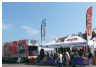
エヴァンゲリオンレーシング