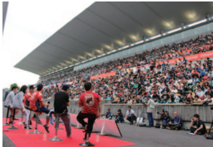
不安定な天気にもかかわらず、多くのお客さまがグランドスタンドにつめかけました。

28日(土)に行われた恒例の「前夜祭」は、台風12号の影響を考慮して、時間を早めるとともにプログラムを一部変更しての開催となりましたが、トップチームの多くにご出演いただくなど豪華な内容となりました。