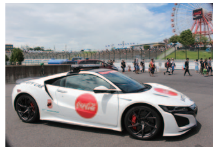
コカ・コーラのカラーリングが施されたセーフティカー、Honda NSX。