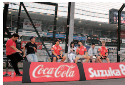
ヨシムラ スズキ MOTULのトークショー。