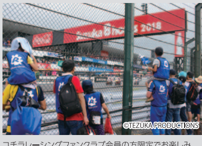
コチラレーシングファンクラブ会員の方限定でお楽しみいただいたイベント「めっちゃ近い! スタート体験」。

PICK UP 1 文字通り「#ハンパない」観戦エリアがコカ・コーラブリッジのスタンド側に設置されました。