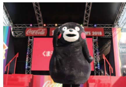
Hondaモンキー・くまモンバージョンでバイクにゆかりの深い、おなじみのくまモンが「コカ・コーラ」イベントステージに登場しました (27、29日)。