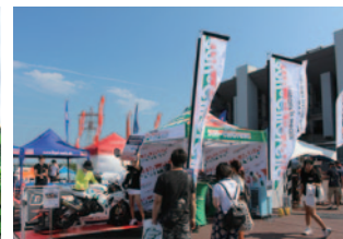
株式会社サン・クロレラ