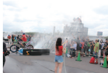
各デモンストレーションの後行われた“びしょぬれイベント”「8耐!夏のスプラッシュタイム」。