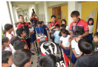
鈴鹿市主催により市内小学校4校を訪問して行われたHonda Suzuka Racing Teamのメンバーによる鈴鹿8耐特別講義(6月8日(金)・25日(月)・26日(火))。協力:NPO法人鈴鹿モータースポーツ友の会