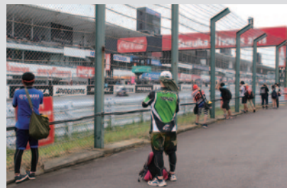
観戦券をお持ちで、かつ「#ハンパない」をつけて各自のSNSで発信されたお客さまを対象に設置された観戦ゾーン「激近エリア」。