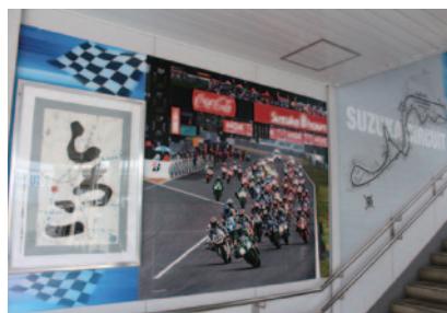
7月20日(金)、近鉄白子駅西口階段にモータースポーツモードを喚起させる常設PRギャラリーが登場(企画・設置:鈴鹿市)。2輪レースを代表して8耐がクローズアップされています。