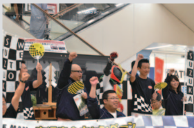
鈴鹿商工会議所青年部による「バイクであいたいバレー」PR。

7月15日(日)市内ショッピングモール「イオンモール鈴鹿」にて、鈴鹿8耐地元チーム壮行会&安全祈願(主催:NPO法人鈴鹿モータースポーツ友の会)とF.C.C. TSR Honda France ル・マン24時間&オッシュャスレーベン8時間優勝報告会(主催:鈴鹿市)が行われました。