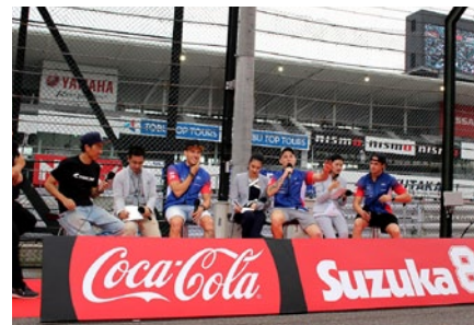
F.C.C. TSR Honda Franceのトークショー。