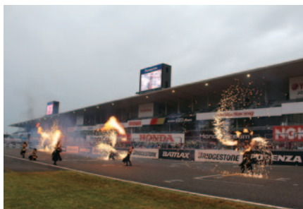
炎と光のエンターテインメントを行うパフォーマンスアートプロジェクト、「かがづち」による迫力の演技。