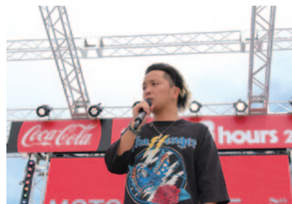
「8FES」に出演した175RのボーカルSHOGO氏のトーク(29日)。