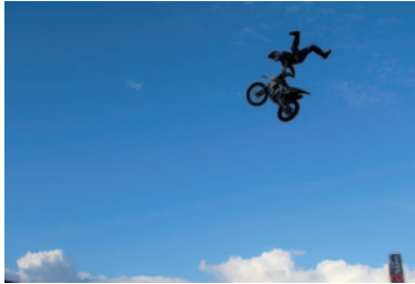
「BIKE! LIVE! パフォーマンス」FMXスプラッシュパフォーマンス。驚異のジャンプテクニクで会場は興奮の渦に。

鈴鹿サーキット交通教育センター (STEC) 特設会場を舞台としたバイクイベント「BASE8耐」。台風12号の影響により、一部イベントは中止となりましたが、会場は「#ハンパない」イベントにファンの熱い熱気であふれていました。