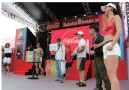
「コカ・コーラ」ガールがカラーボトルの色で連想するシチュエーションを当てた方にステキな賞品がプレゼントされたゲーム (27、29日)。