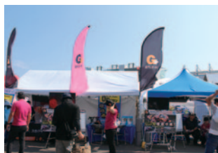
日本テレビ放送網株式会社