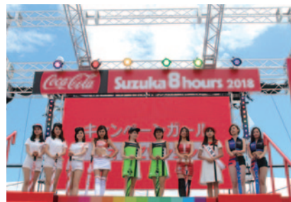
各チームのキャンペーンガールが一堂に会した「キャンペーンガールフォトセッション」(29日)。