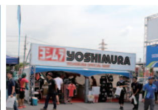
株式会社ヨシムラジャパン