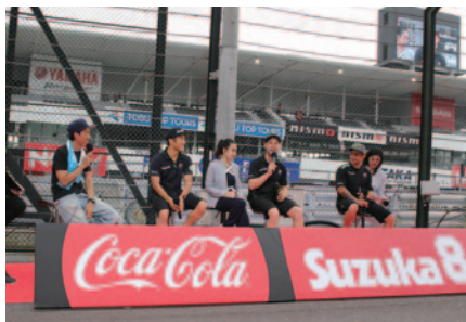
Kawasaki Team GREENのトークショー。