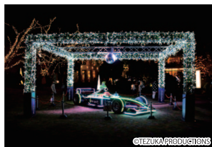
ホテルガーデンを彩る「コチラレーシング イルミネーション」。光り輝くF1マシンを中心にミラーボールやクリスマスツリーが幻想的な世界を演出しています。