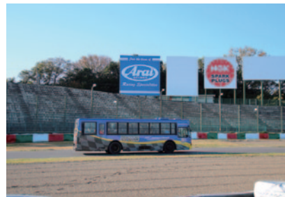
公式予選開始前に運行された下見バス(25日)。鈴鹿以外のサーキットを本拠地とするライダーが多い本大会、安全なレースに向けての重要な施策です。