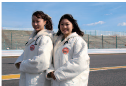
鈴鹿サーキットクイーンのお二人もNGKスパークプラグロゴ入りコスチュームを着用、進行や表彰式のお手伝いなど大会に華を添えました。