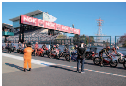
ホームストレートのNGKスパークプラグブリッジ。大会のランドマークとして鮮やかな輝きを放ちました。