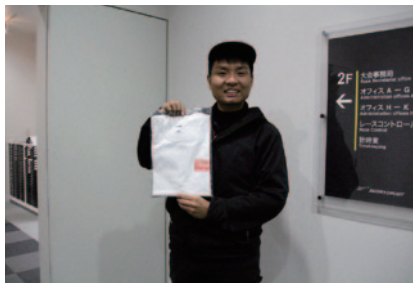
記念品として参加者全員に配布されたNGKスパークプラグロゴ入りシャツ。袖には大会の日付が入っています。

半世紀以上もの長きにわたって冠スポンサーとして支えていただいている日本特殊陶業株式会社様。鈴鹿サーキットは、今年も赤色のNGKスパークプラグロゴに彩られ、ライダー達の情熱を後押ししていただきました。