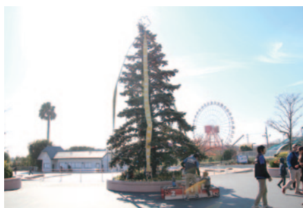
ゆうえんちモートピア内ウェルカム広場に登場したビッグなクリスマスツリー。秋の終わりと冬の到来を印象付ける「NGKスパークプラグ杯」の風物詩です。