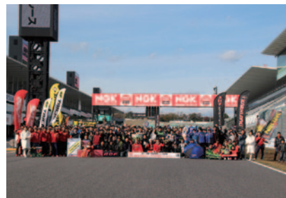
恒例の参加者・関係者による集合写真。来年のメインビジュアルとなるショットがたくさん笑顔とともに撮影されました(25日)。