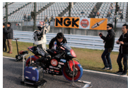
ポールポジション横のNGKスパークプラグ横断幕。ホームストレートには計3枚のNGKスパークプラグ横断幕が掲出されました。