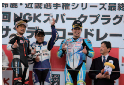
各クラス決勝上位3選手にはNGKスパークプラグキャップが贈呈されました(26日)。