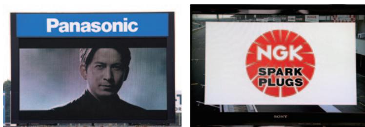
日本特殊陶業株式会社