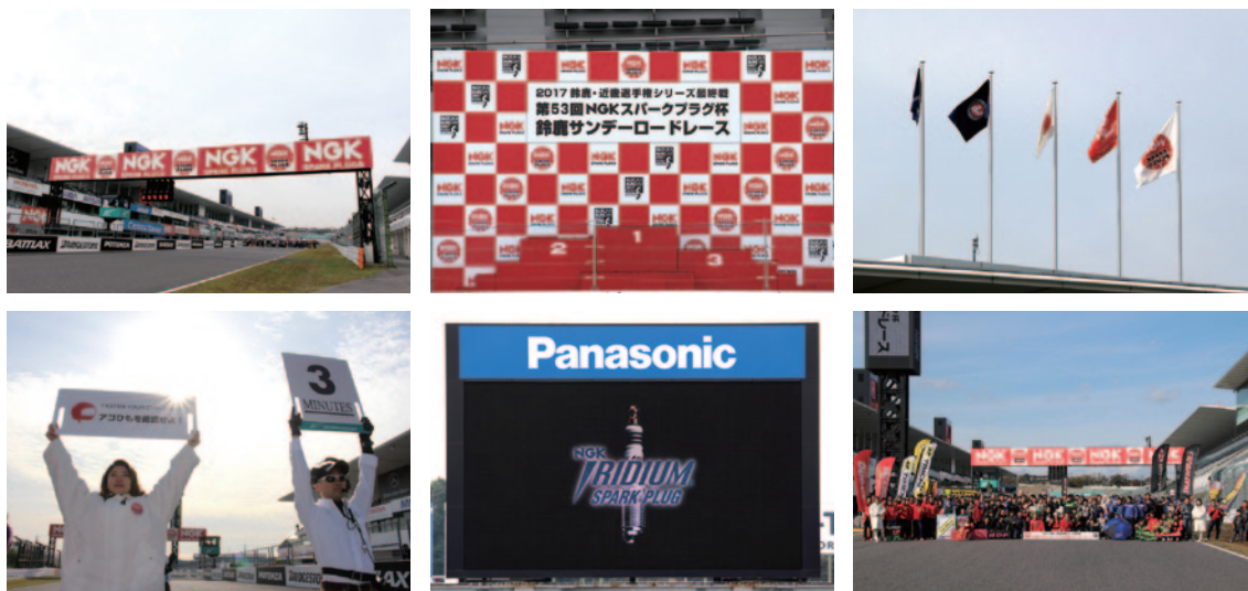
日本特殊陶業株式会社