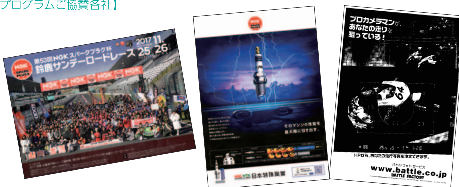
A4カラー /モノクロ 24p