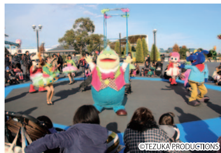
11月3日にお誕生日を迎えたコチラファミリーのブート。そのお誕生会がゆうえんちモートピア内プッチタウンストア前で行われました。