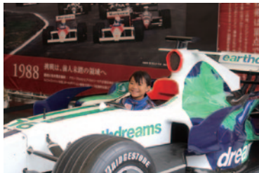
レーシングスーツ着用でホンモノのF1を感じていただいた「Honda RA108コックピット体験」(グラウンドスタンドプラザ)。