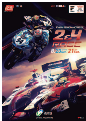
大会公式プログラム