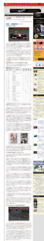
Car Watch 8月15日(月)