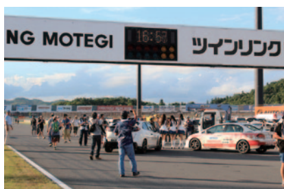
スーパーフォーミュラ決勝の余韻冷めやらぬロードコースを歩いてご体験いただいた「コースウォーク」(21日)。