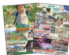
TRM Press 8月1日(月)