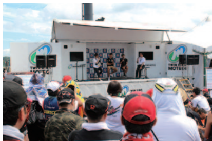
小林可夢偉選手(右から2人目)、石浦宏明選手(右から3人目)が登場しての「スーパーフォーミュラ ドライバートークショー」(21日 グランドスタンドプラザ スーパーフォーミュラオフィシャルステージ)。