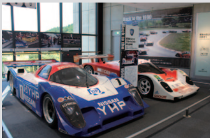
モータースポーツが空前の盛り上がりを示した1990年前後。その立役“車”にフォーカスした特別展示「Back to the 1990」(9月1日〈木)まで)。