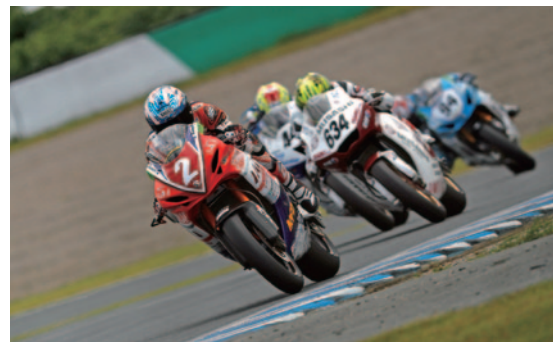
J-GP2クラス トップ争い(先頭は生形)