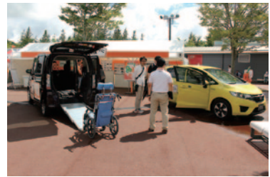
移動の喜びを一人ひとりに—福祉車両の展示、手動運転体験などが行われた「福祉車両展示」(グラウンドスタンドプラザ)。