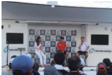
Honda Racingのスーパーフォーミュラドライバートーク「Honda Racingドライバーアピランス」。ベルトラン・パグエット選手(右)とストフェル・バンドーン選手(中)のセッション(20日スーパーフォーミュラオフィシャルステージ)。