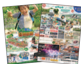
TRM Press 7月14日(木)