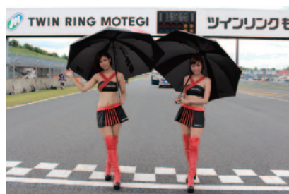
スーパーフォーミュラ決勝スタート前のグリッドを彩ったヨコハマタイヤのイメージガール。