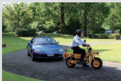
Honda Collection Hall所蔵マシンによるデモラン「ウィークエンドラン」。手前は「モトラ」(1982年)、後方は「CR-X Delsol」(1992年)。