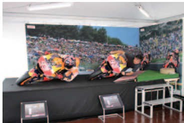
バンク角60度といわれるMotoGP™のポジションを体験いただいた「ナリキリ! MotoGP™ライダー」(グラウンドスタンドプラザ)。