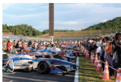
決勝レースを終えたばかりのスーパーフォーミュラの車両保管場所(パークフェルメ)の間にアクセスいただいた「パークフェルメウォーク」(21日)。