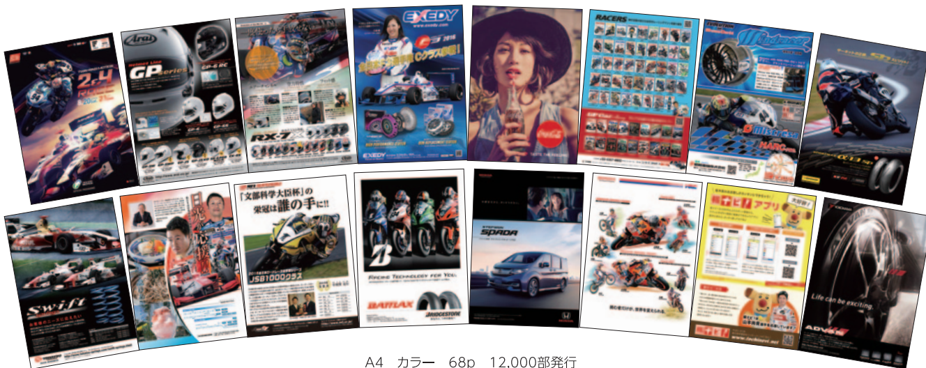
A4 カラー 68p 12,000部発行

株式会社アライヘルメット 株式会社エクセディ コカ・コーライーストジャパン株式会社 株式会社三栄書房 昭和電機株式会社