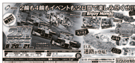
東京中日スポーツ 全5段×5回