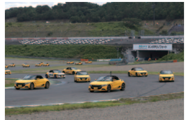
Honda S660オーナーがロードコースをパレードランしました。