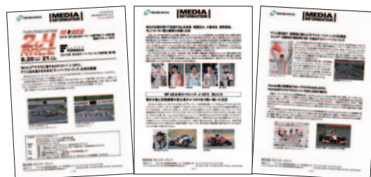
プレスリリース 5月12日(木)