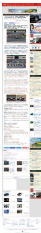
Car Watch 6月8日(水)