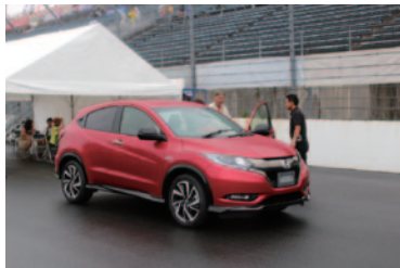
Hondaの安全支援システム「Honda SENSING」搭載車両に同乗いただき、衝突軽減ブレーキ(CMBS)をご体験いただきました(スーパースピードウェイ)。