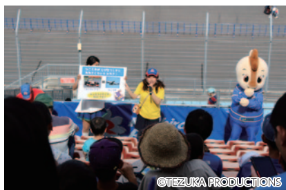
チケットがなくても公式予選を観戦できる「コチラファンクラブ限定観戦席」。お子さまにもわかりやすいレース解説を、コチラレーシングと一緒に楽しみいただきました(20日グランドスタンドA席)。