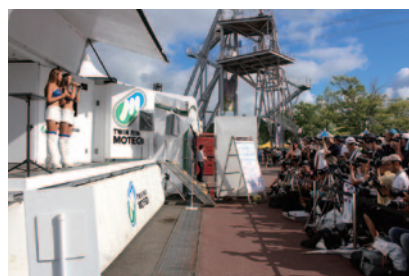
各チームのレースクイーンが一堂に会し、華やかに繰り広げられた「レースクイーンステージ」(スーパーフォーミュラオフィシャルステージ)。