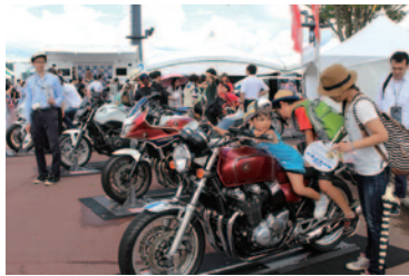
人気の最新車種が勢ぞろい。バイクの楽しさを見て、乗って、ふれて、体験していただいた「バイク展示」(グラウンドスタンドプラザ)。