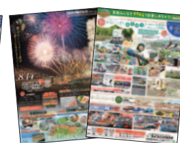
TRM Press 8月6日(土)