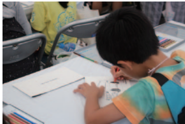
小学生以下のお子さまにぬり絵でクルマのカラーデザインにチャレンジいただいた「ホンダ・アクセス キッズデザイン研究所」(グラウンドスタンドプラザ)。