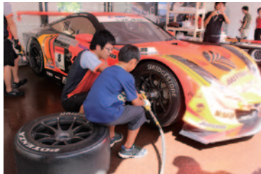
2010～2013年にSUPER GTに参戦したHSV-010GTのタイヤ交換に挑戦していただきました(グラウンドスタンドプラザ)。