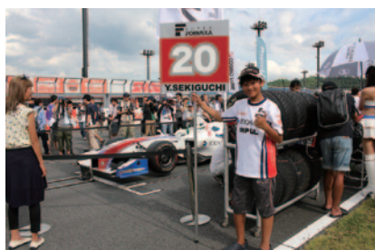
スーパーフォーミュラ(写真)、そして全日本F3選手権のスタート前の各車をエスコートいただき、緊張のグリッドを味わっていただいた「グリッドキッズ」。