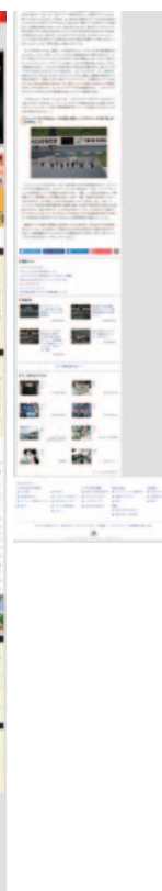
Car Watch 8月19日(金)