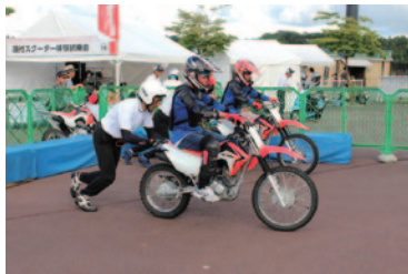
中学生以上の方にバイクの操作方法と体験走行をお楽しみいただいた「免許がなくてもバイク体験」(グラウンドスタンドプラザ)。