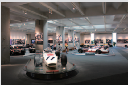
歴代のHonda F1マシン30台が3階4輪レース車フロアを埋め尽くした「オール ホンダF1マシン特別展示」(10月10日〈月・祝)まで)。

Honda Collection Hallでは、展示・デモラン・トークショーなどさまざまなイベントが開催されました。