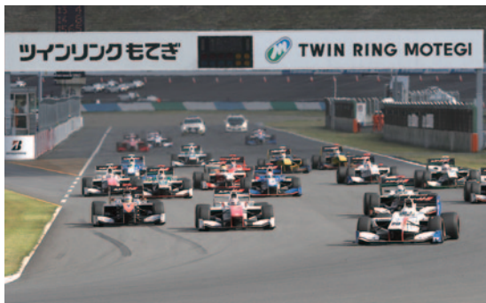
スーパーフォーミュラ決勝スタート