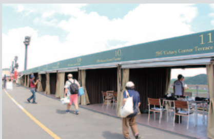
最終コーナーからストレートにかけての熱いバトルが観戦できるピクトリーコーナーに、グランピングスタイルのレース観戦を楽しめるエリア、モニターと屋根が付いた空間「ピクトリーテラス」(写真)とエリアを自由に使える「SORAサイト」が登場しました。