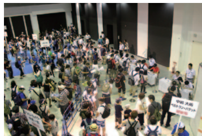
スーパーフォーミュラドライバーが多数参加、ファンとの交流を楽しんだ「スーパーフォーミュラ スペシャルサイン会」(20日 ファンファンラボ)。