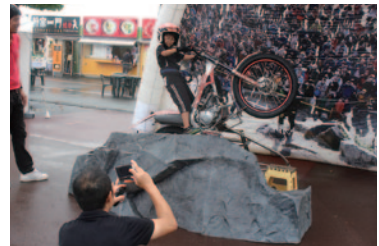
バイクライアルの2大テクニク、ウイリー(写真)とジャックナイフを体験いただいた「ナリキリトライアルライダー」(グラウンドスタンドプラザ)。