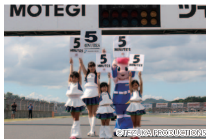
決勝レーススタート前のコース上でツインリンクもてぎエンジェルと共にスタート前ボードを掲出できるスペシャル体験! 「ドリーム☆変身Pit エンジェルスペシャル〜スタート直前! ドキドキのカウントダウンボードアップ!〜(スーパーフォーミュラ/F3/J-GP2)。