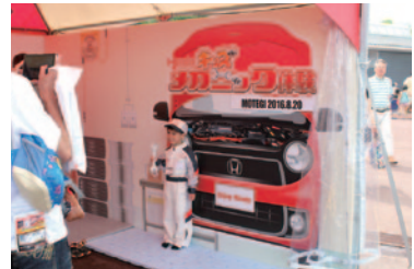
タイヤ、オイル、バッテリー、ワイパー&ウォッシャー液チェックなど小学校低学年のお子さまにクルマの整備を体験いただいた「キッズメカニック体験」(グラウンドスタンドプラザ)。