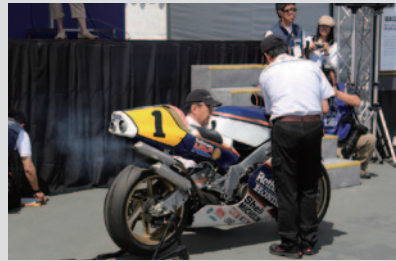
'89 Honda NSR500(4気筒)のエンジン始動 Sound of NSR。