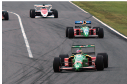
A.セナのF1デビューマシンToleman TG184(奥)をはじめ、各時代を彩ったF1マシンデモレースを展開したLEGEND Formula1 Demo Race。