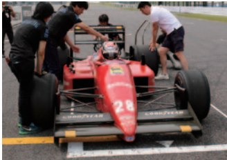
Featuring Machine 【F1】Ferrari F187(1987)

海外・国内から鈴鹿に集結した貴重な個体は、いずれもつくり手やオーナーの愛情と情熱が感じられる素晴らしいコンディションでファンの前に現れ、走行・展示・エンジン始動などさまざまなイベントを彩りました。