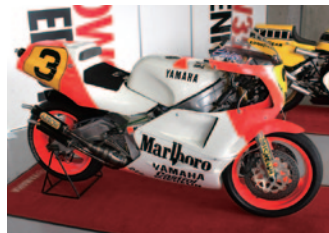
【WGP500】 YAMAHA YZR500/0W98(1988)