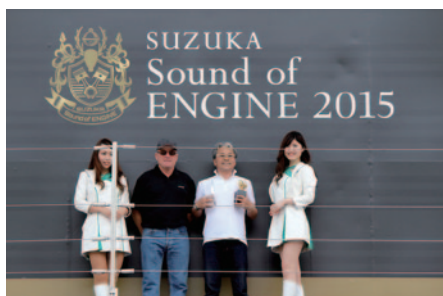
SUZUKA Attack Lap & High Speed二輪部門表彰のプレゼンターはケニー・ロバーツ氏につとめていただきました。