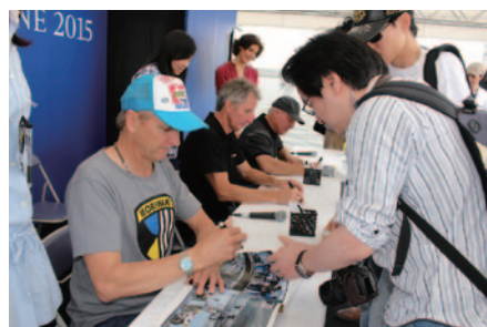
レジェンドライダーたちによるサイン会。じゃんけん大会で勝った幸運なファンたちが参加しました(GPスクエアステージ)。