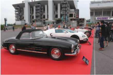
世界のプレミアムブランドの往年の名車や最新モデルが展示され、人気投票も行われたCONCOURS d'ELAGANCE。