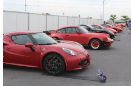
世界のスーパーカーが大集合したSUPER CAR COLLECTION。