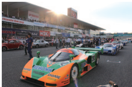
イベントの最後を飾ったFinale Parade。ほとんどのマシンが参加して豪華なエンディングを飾りました。