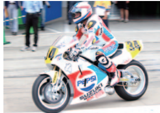
Featuring Machine 【WGP500】PEPSI SUZUKI RGV-F(1989)