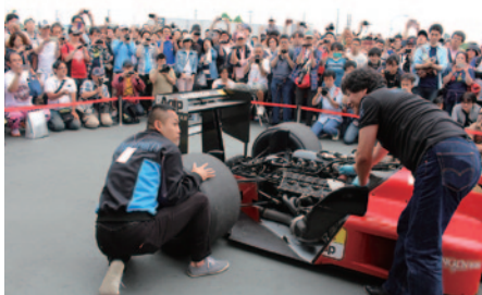
Ferrari F187のエンジン始動(GPスクエアステージ)。