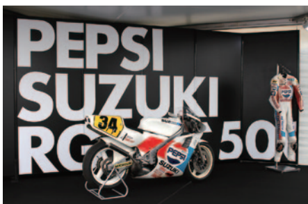
GPスクエアに展示されたPEPSI SUZUKI RGV-F(走行車両とは別の個体)。