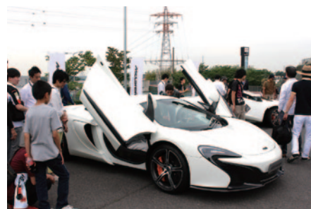
最新モデルMcLAREN650sが展示されたMcLARENブース(GPスクエア)。