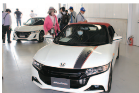
ピットに展示されたHonda S660。カスタマイズモデルも展示されました。