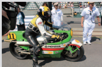
LEGEND WGP Demo Raceで Kawasaki KR500をサプライズライディング!