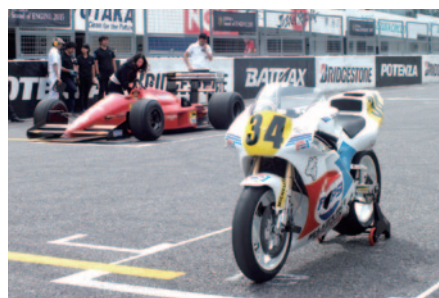
コース上に並べられた2台のFeaturing Machine。