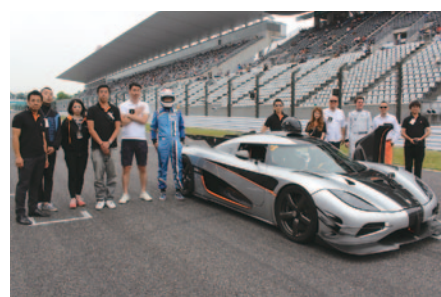
スウェーデンのKoenigseggは、同社20周年記念モデルOne:1のピット展示と同乗走行を実施しました。