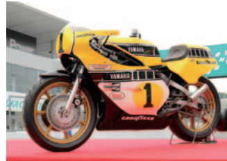
【WGP500】 YAMAHA YZR500/0W35K(1978)