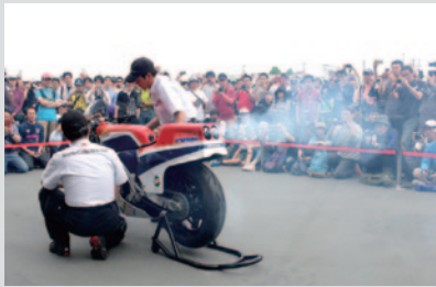
'84 Honda NS500(3気筒)のエンジン始動 Sound of NS。

GPスクエアステージでは、'80年代のHonda WGP500ccマシンのエンジン始動が行われ、エンジン形式によるサウンドの違いをお楽しみいただきました。