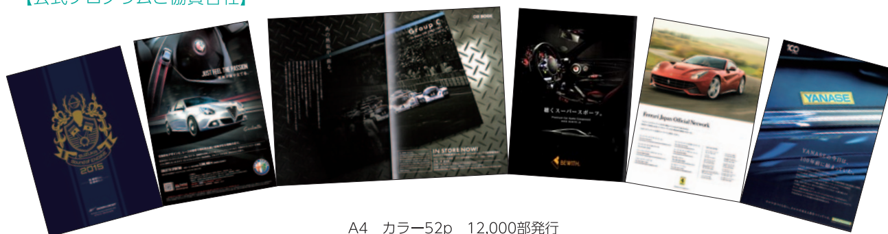
A4 カラー52p 12,000部発行

FCAジャパン株式会社 ビーウィズ株式会社 株式会社ヤナセ 株式会社カーグラフィック フェラーリ・ジャパン株式会社