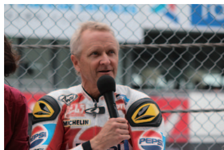
PEPSI SUZUKI RGV-Fをライドしたケビン・シュワantz氏。