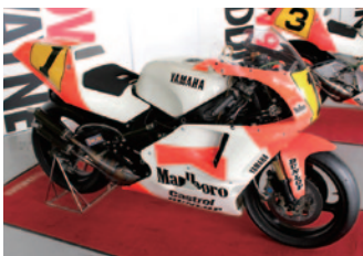
【WGP500】 YAMAHA YZR500/0WC1(1990)