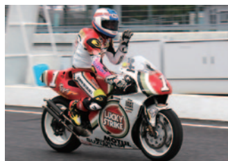
【WGP500】 LUCKY STRIKE SUZUKI RGV-F(1994)