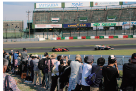
2コーナーイン側からマシンの走りを間近にご覧いただいた「激感エリア」。