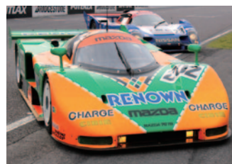
【Gr.C】MAZDA 787B (1991)