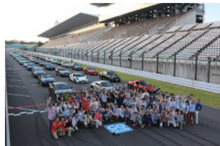
全イベント終了後、CAR GRAPHICの読者の皆さんによる国際レーシングコース体験走行が行われました。