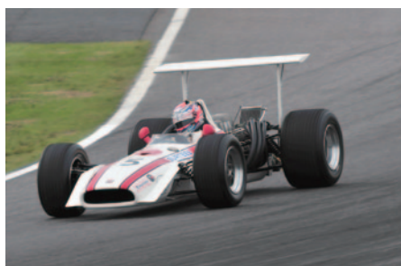
Honda F1第一期最強と称されたRA301が迫力の12気筒サウンドを響かせたSound of Honda F1。