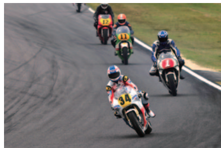
海外から招聘しWGP500ccクラスのマシンによるLEGEND WGP Demo Race。