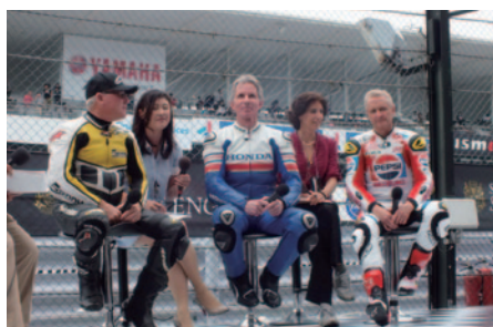
世界GP500ccクラスのレジェンドライダーたち(左からケニー・ロバーツ、エディ・ローソン、ケビン・シュワツの各氏)によるSound of GPトークショー。