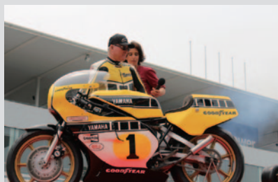
1978年に初のGP500チャンピオンを獲得したYAMAHA YZR500のエンジン始動が国際レーシングコースのホームストレート上特設ステージで行われました。

1978年からWGP500ccクラスで3年連続チャンピオンを達成した”キング”ケニー・ロバーツ氏。当時のマシンとともに登場するなど、大きな注目を集めました。