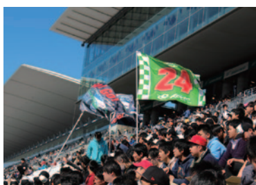
日産愛知自動車大学校