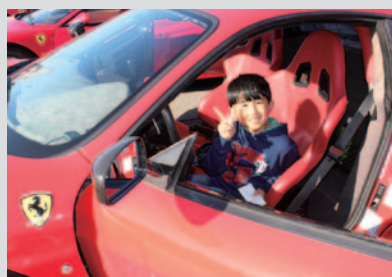
あこがれのスーパーカーのコックピットに。