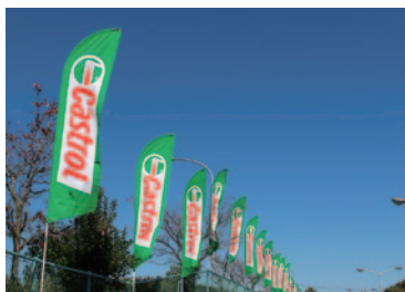
カストロール株式会社