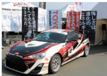
トヨタ自動車株式会社