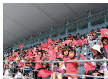
三菱自動車工業株式会社