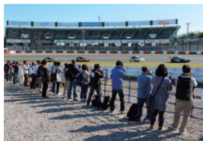
パドックパスをお持ちの方を対象に、マシンの走りが間近に観られる「激感エリア」を設定いたしました。 場所：第2コーナー(写真)、S字コーナー、最終コーナー