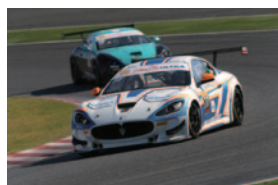
Race 2 アレッサンドロ・フォグリアニ

【Honda Sports & Eco Program CR-Z 10リッターチャレンジ】