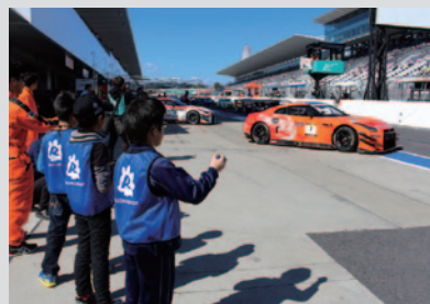
コースインするマシンの台数を確認！