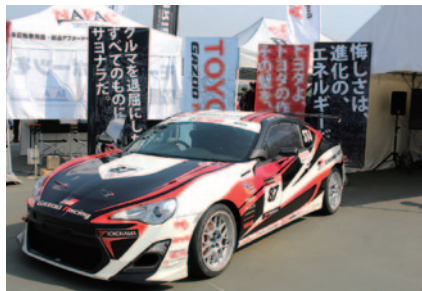
GPスクエアに設置されたTOYOTA GAZOO Racingブース。