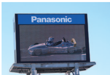
スーパー耐久決勝前には、パットが「FE810」をドライブしながら、鈴鹿サーキット国際レーシングコースを解説しました。