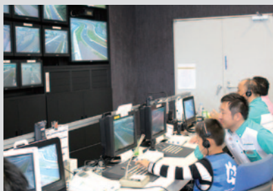
コース全体を監視するコントロールルームで管制作業。