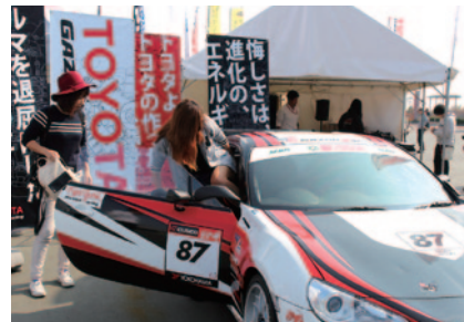
TOYOTA GAZOO Racingブースで実施されたスーパー耐久ST-4クラス仕様トヨタ86の展示・搭乗体験。