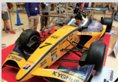
スーパーフォーミュラ[SF13]の搭乗体験。