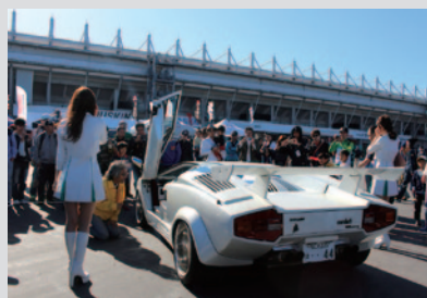
迫力のエンジンサウンドをお楽しみいただいた「エンジンサウンドパフォーマンス」。