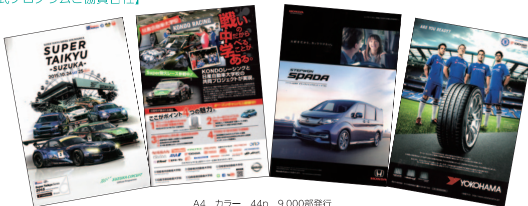
A4 カラー 44p 9,000部発行