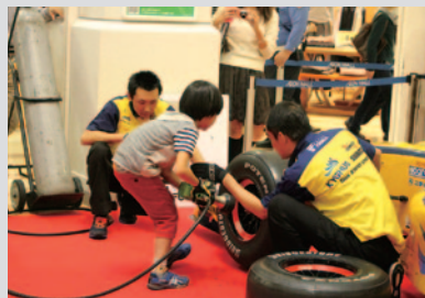
「SF13」タイヤ交換体験は大人気でした。