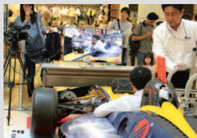
コックピット搭乗の様子を撮影するサービス。