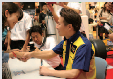
サイン会でファンとこやかに交流する小林可夢偉選手。