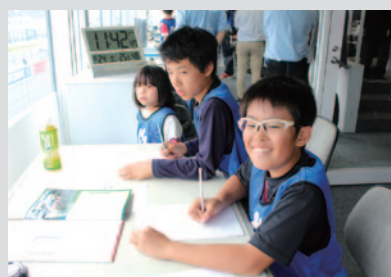
通過するマシンの順位・ゼッケンを記録！