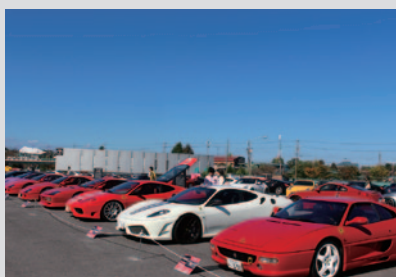
GPスクエアでの壮観な展示風景。

フェラーリ、ランボルギーニ、ポルシェなど世界のスーパーカーが集結。展示はもとより、さまざまな角度からスーパーカーを体験できるイベントがGPスクエアを中心に展開されました。