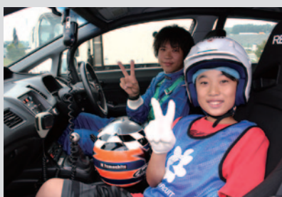
マーシャルカーに乗ってレーシングコースの安全チェック！

コチラレーシングファンクラブ会員を対象に、レースを支えるオフィシャルのお仕事をさまざまなセクションで体験いただきました。