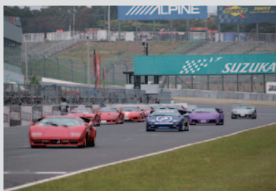
小中学生を対象に実施された国際レーシングコース同乗体験「サーキットエクスペリエンス」。