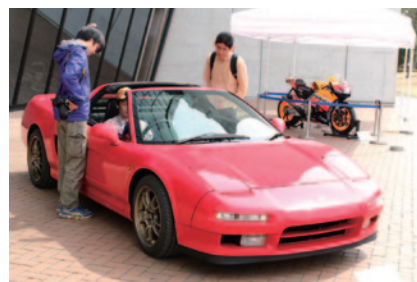
Honda NSXやMotoGP™マシンに乗って写真撮影ができる「座って撮ろう～思い出持ち帰りフォトコーナー」(Honda Collection Hall 28、29日)。