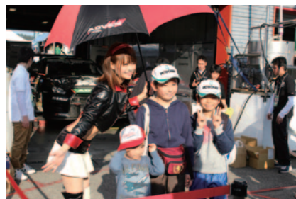
中学生以下のお子さまと同伴者の方に無料で楽しんでいた「コチラレーシングのキッズピットウォーク」(28日)。