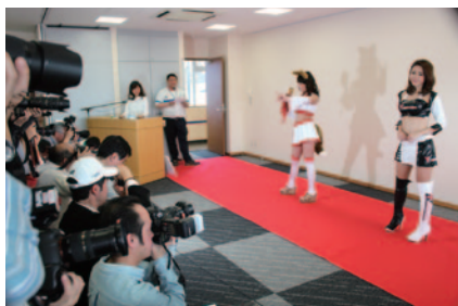
人気投票「ST GIRL 50」で選ばれたレースクイーン50名が登場するスペシャルイベント「レースクイーンフォトフェスタ」。VIPスイートでの観戦、お食事がセットになったプレミアムプランです(29日)。