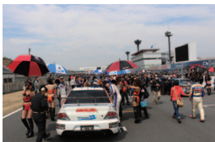
中学生以下のお子さまと同伴者先着500名に無料でS耐決勝前のスターティンググリッドをお楽しみいただいた「ドキドキ体験ファミリーグリッドウォーク」(29日)。