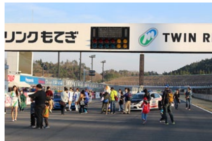
公式予選日の全セッション終了後にロードコースを開放、熱い走りの余韻が残るサーキットをご体験いただいた「家族みんなでコースウォーク」(28日)。