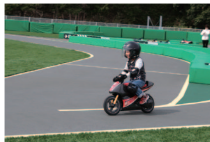
モビパークにこの春新登場した本格的バイクアトラクション「モトレーサー」。EVバイクで走る喜びと競う楽しさをご体験いただけます。