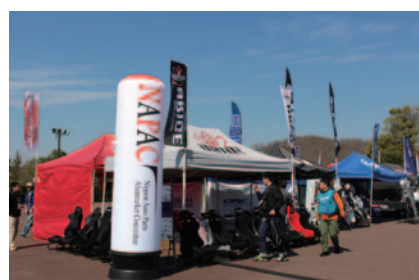
自動車用品、アフターマーケットの振興を図るNAPAC(日本自動車用品・部品アフターマーケット振興会)加盟各社様のブースがグランドスタンドプラザで展開されました(28、29日)。