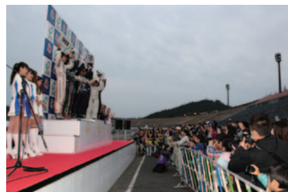
表彰式をまぢかでお楽しみいただける、中学生以下のお子様連れのファミリー限定の優先エリア「表彰式 ファミリーエリア」(29日)。