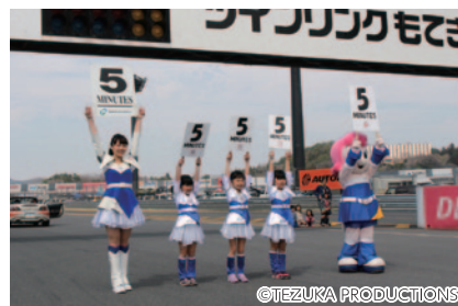
ツインリンクもてぎエンジェルと一緒にカウントダウンボードを掲出いただいた「ドリーム☆変身Pitエンジェルスパシャル! ~スタート直前! ドキドキのカウントダウンボードアップ! ~」(29日)。