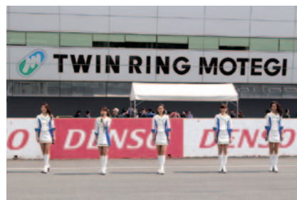
ツインリンクもてぎエンジェル第17期生がピットウォーク時に紹介されました(29日)。