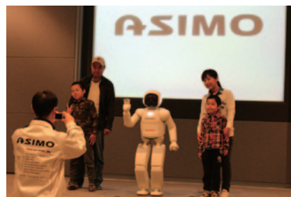
Honda Collection Hallで行われた二足歩行ロボットASIMOとの記念撮影タイム(28、29日)。