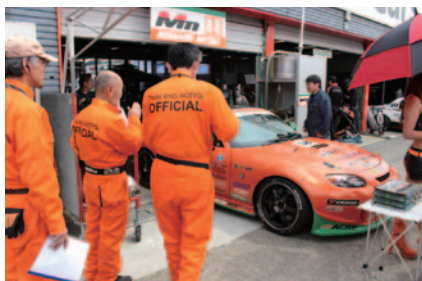
ピットウォーク時に行われた「公開車検」(29日)。