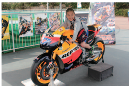
「モトレーサー」乗り場横に設置されたMotoGPTMマシン(Honda RC212V) 搭乗体験コーナー。