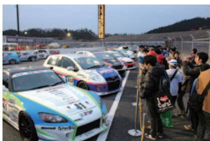
決勝レース終了後の車両保管エリア(パークフェルメ)近くで熱戦を終えたばかりのマシンをご覧いただいた「パークフェルメウォーク」(29日)。