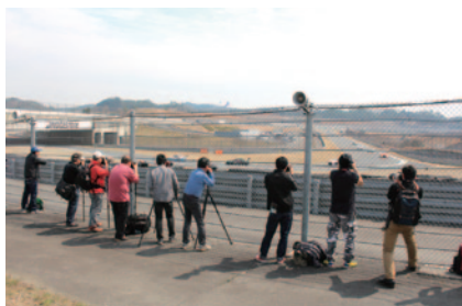
5コーナーアウト側(写真)、東コースピット裏で大迫力の観戦をお楽しみいただいた「激感エリア」。