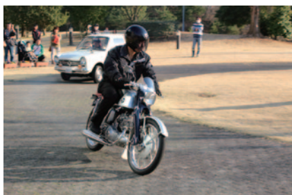
Honda Collection Hall所蔵車両のデモンストレーション走行「ウィークエンドラン」(28、29日)。 走行車両: Honda ベンリイCB92スーパースポーツ(手前)、Honda N360(後方)、Honda CB750F、Hondaプレリウド