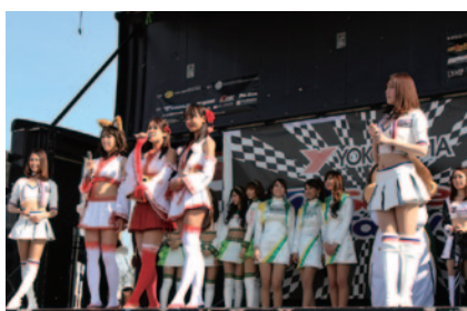
グランドスタンドプラザのスーパー耐久オフィシャルステージで行われた「キャンギャルオンステージ」(28、29日)。