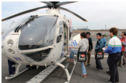
コントロールタワーや救急ヘリを間近にご覧いただいた「サーキット・ツアーズ&ドクターヘリ見学」。

おだやかな天候に恵まれた大会期間。場内ではレース以外にも多彩なイベントが展開され、お客さまに3月最後の週末をお楽しみいただきました。