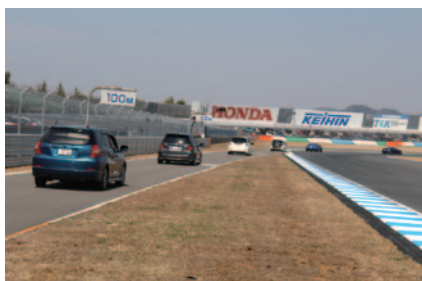
2006年以降S耐に参戦した車種による「みんなでS耐パレード」。約104台が参加しました(29日)。