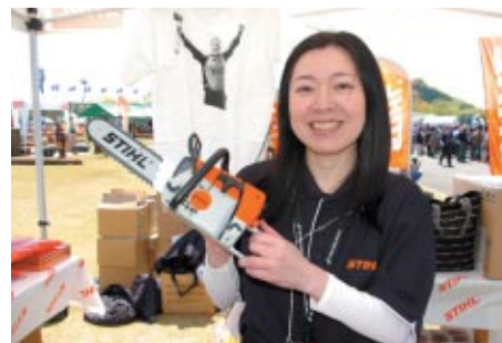
オリジナルグッズの販売ブース。チェーンソーのおもちゃが人気でした。