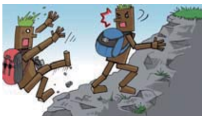
■ケガをしないように気をつけよう!

マナーを守って気持ちよく!、ご来場いただいたすべてのお客さまに自然の中のトライアルを楽しんでいただけるよう「トライアルマナーアップキャンペーン」を実施いたしました。