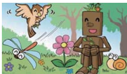
■森の生物を大切に!