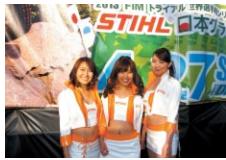
ツインリンクもてぎエンジェルもSTIHLロゴコスチュームで大会を彩りました。