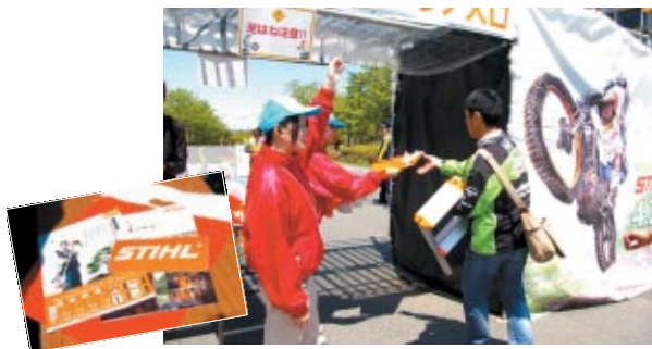
製品案内とステッカーがお客さまに配布されました。