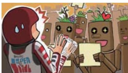
■サインを無理矢理ねだらない!