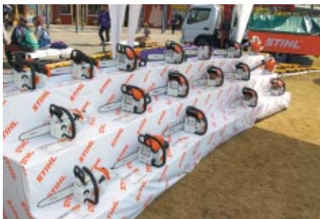
数多くのラインナップを誇るSTIHLチェーンソーの展示ブース。