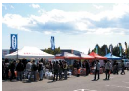
ハローウッズ駐車場には、トライアルをはじめとしたオフロードアイテムが展示・販売された「カスタムフィールド」が設置されました。