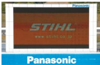
コカ・コーラ ゼロ 株式会社スチール