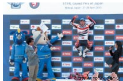
藤波、歓喜のジャンプ!