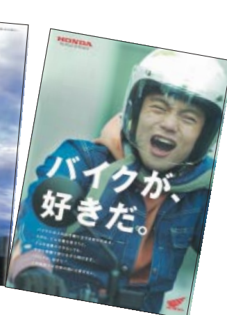
A4 カラー 20p 9,000部発行 ※無料配布