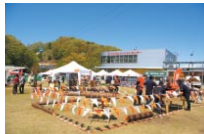
株式会社スチール