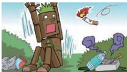
■たばこやゴミのポイ捨てをしない!