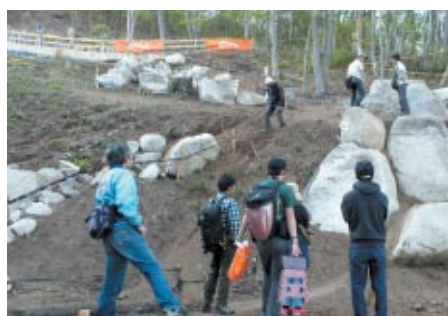
DAY2の公式スケジュール終了後にはセクション1・2・3をお客さまに開放、その難しさを実感いただきました。