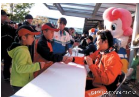
DAY1の公式スケジュール終了後に行われたライダーサイン会。