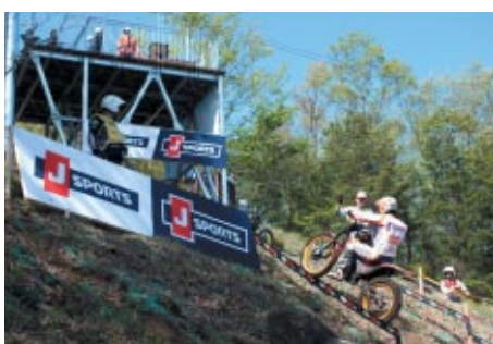
「J SPORTSゾーン」として設定された6セクションに掲出されたJ SPORTSバナー。