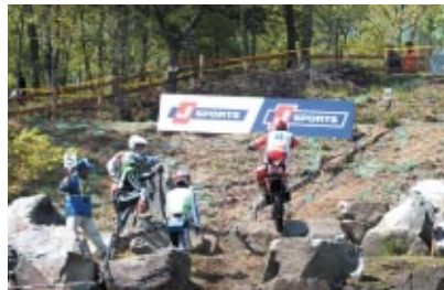
株式会社ジェイ・スポーツ