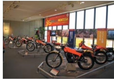
Honda Collection Hallでは「PROUD of MONTESA」と題してトライアル王国スペインの強豪メーカー「モンテッサ」のマシンを中心にその歴史を紹介しています(5月10日〈金〉まで)。