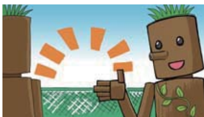
■ゆずり合って観戦しよう!