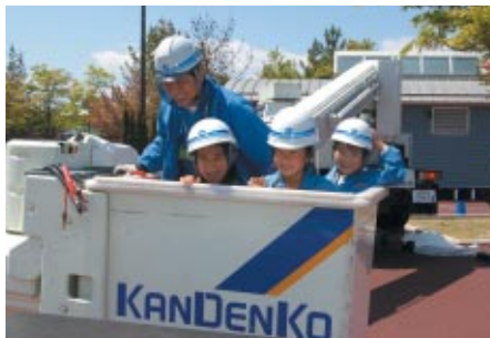
グランドスタンドプラザに展示された動くクルマの数々。高所作業車体験(写真)などファミリーの歓声があふれていました。