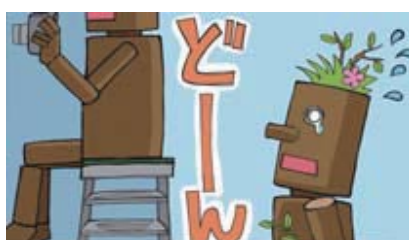
■脚立の使用は、後ろを気にして!