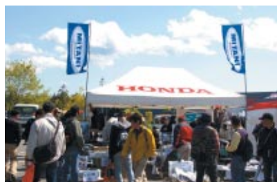
アズーロ・モト 株式会社シルバースター (SpeedSports) 有限会社テクニクス 株式会社美貴本 (CONTOUR) 株式会社ミタニ