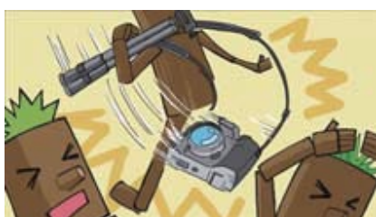
■カメラのレンズを振り回さない!