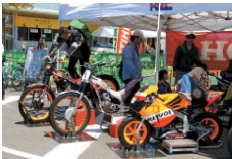
トライアルワークスマシンはもとよりMotoGPマシンなど、オフ&オンのレーシングマシンの展示・搭乗体験が行われたHRCブース。