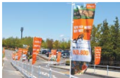
株式会社スチール