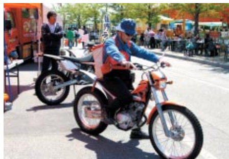
ヤマハエンジンを搭載するフランスのSCORPA製トライアルマシンの展示・搭乗が行われました。