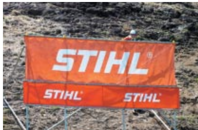
株式会社スチール