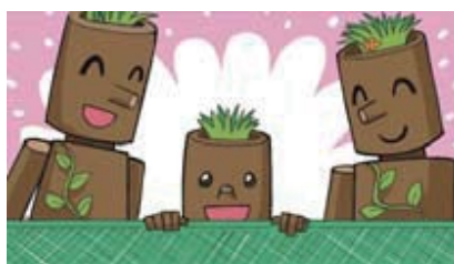
■子どもにやさしく!