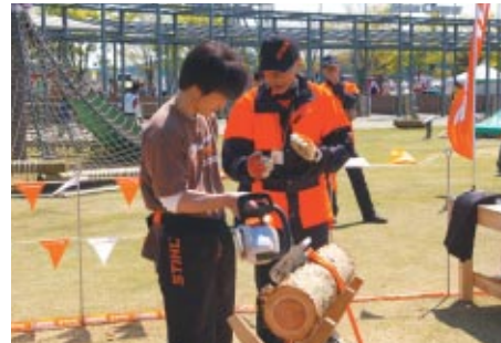
お客さまにSTIHL製品をご体験いただいたコーナー。