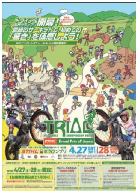
スペシャルチラシ