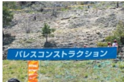
株式会社パレスコンストラクション