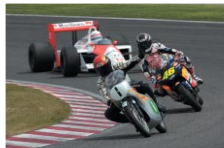
Hondaの名レーシングマシン、マクラレンMP4/4、RC164、 RC211Vが中嶋悟さん、宮城光さん、玉田誠選手によって往年の 走りを披露しました(14日)。