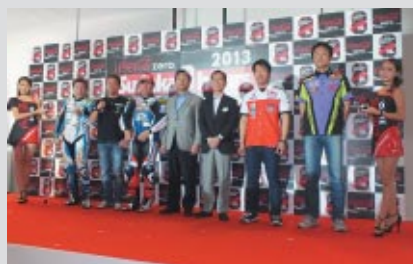
参加予定チーム・選手、そして関係者の皆さんによる記念撮影