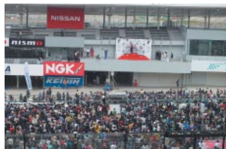
スーパーフォーミュラの表彰式は、熱戦の余韻冷めやらぬレーシングコースを開放して行われました。