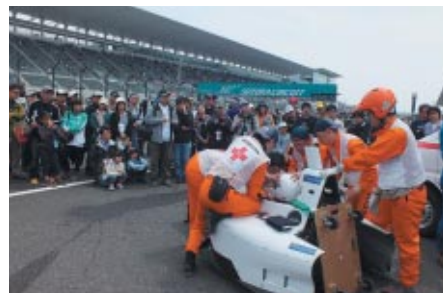
ピットワーク中に行われたレスキューオフィシャルによるドライバー救出実演。