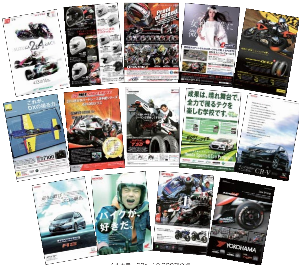
A4 カラー68p 12,000部発行

株式会社アライヘルメット 株式会社三栄書房 株式会社ジェイ・スポーツ 住友ゴム工業株式会社