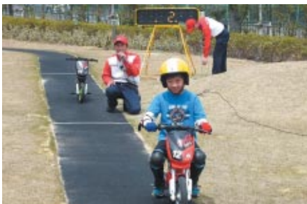
アトラクション「レーシングシアター」前のミニレーシングコースで「ツーリングバイク」を使ったタイムアタック大会が行われました。