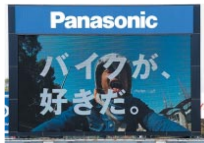
株式会社ホンダモーターサイクルジャパン