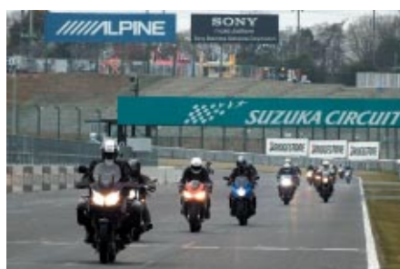
バイクでご来場の方を対象に無料で国際レーシングコース体験走行をお楽しみいただいた「サーキットクーリング」(14日)。