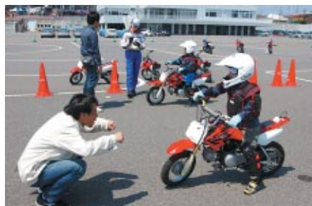
鈴鹿サーキット交通教育センターのプログラム「親子でバイクを楽しむ会」のノウハウを生かした親子バイク体験。