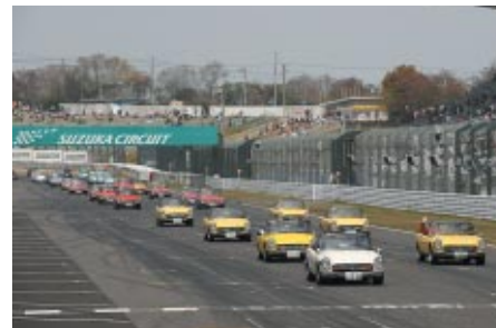
Hondaの4輪販売50年を記念して歴代の車両(写真)や200万台を 達成したFITがレーシングコースをパレードしました(14日)。