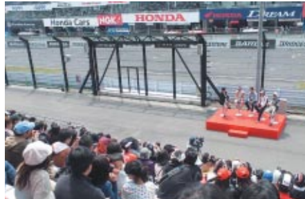
Honda Racingのドライバー(写真)とライダーのトークショーがグランドスタンドの大観衆の前で行われました。