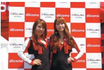
NTTドコモブースで行われたDOCOMO TEAM DANDELION RACINGサーキットレディ撮影会。