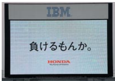
本田技研工業株式会社