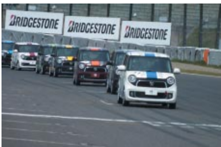
キュートな「N-ONELレーススタディモデル」のエキシビジョン 走行が行われました(14日)。