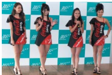
ホスピタリティラウンジバスをお持ちの方を対象に行われた「レースクイーンフォトセッション」(14日)。