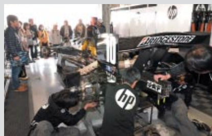
地元チームのピットを訪問するプレミアムイベントも。