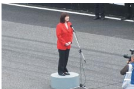
スーパーフォーミュラのエンジンスタートコールを行っていただいた末松則子鈴鹿市長(14日)。