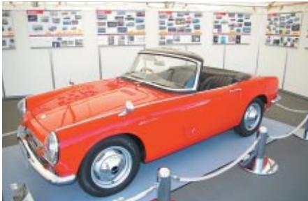
Hondaが4輪販売をはじめて今年で50年。市販第1号車のT360やS500(写真)が展示されました。

大会期間の4月13日(土)、14日(日)の二日間、場内では「Enjoy Honda SUZUKA 2013」が開催され、「いろんなHonda」をお客さまにお楽しみいただきました。