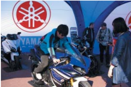
Yamahaブースで行われたニューモデルの搭乗体験。