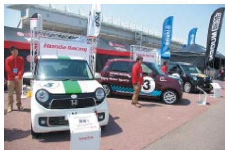
話題の軽自動車N-ONEのレースタディモデル。カラフルなマシン群に乗車体験などで触れていただきました。