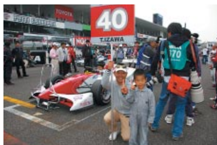
「コチラちゃんファンクラブ」および「コチラレーシングファンクラブ」会員の皆さんにご活躍いただいた「コチラレーシングプレゼントグリッドキッズ」(14日 SF)。