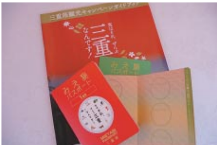
三重県観光PRブースで配布された三重県の観光PRガイドと 三重の名物をめぐる「みえ旅パスポート」。