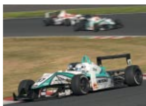
全日本F3選手権 第1戦 勝田貴元