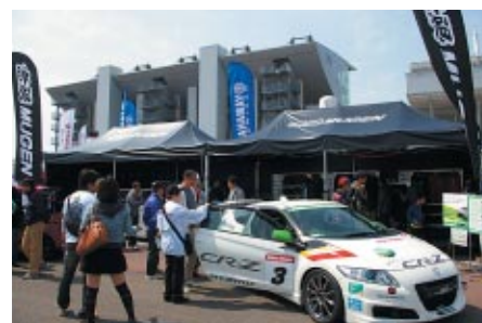
「Honda sports & Eco Program」仕様のHonda CR-Z展示 と搭乗体験が行われたM-TECブース。