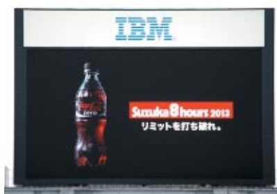
コカ・コーラ ゼロ