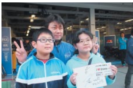
中学生以下のお子さまとご同伴の方を対象に無料で行われたキッズピットワーク(13日)。