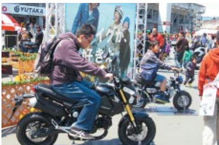
2輪・4輪をはじめ、各ジャンルのHondaニューモデルが一堂に展示されました。