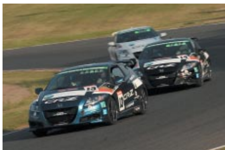
「Honda Sports & Eco Program」の「CR-Z 10リッターチャレンジ」が行われ、エコと速さの両立をはかる戦いが展開されました(13日)。