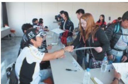
Honda Racingドライバー・ライダーが集合しての豪華なサイン会。抽選で選ばれたお客さまにご参加いただきました。