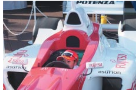
ブリヂストンブースで行われたお子さまのフォーミュラカー コックピット体験。