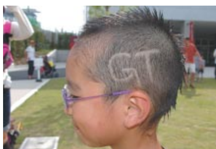
GTカットがわりりしい!