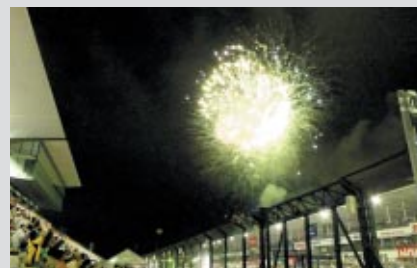
復活祭のエンディングは大輪の花火