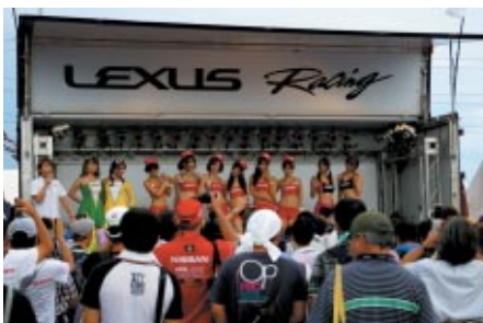
トヨタ系チームのキャンペーンガールが勢ぞろいしたTOYOTAブース