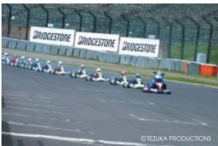
バットを先頭にSRS-K生徒のデモ走行