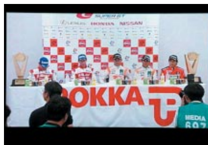
決勝レース後の記者会見がサーキットビジョンで公開されました