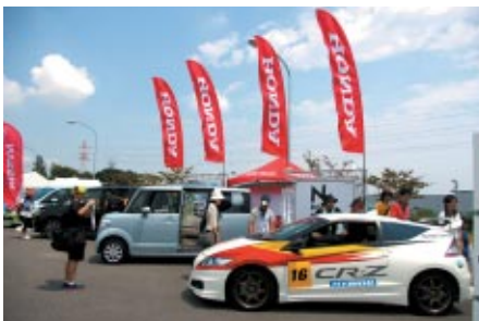
CR-Zやニューモデルが展示されたHondaブース