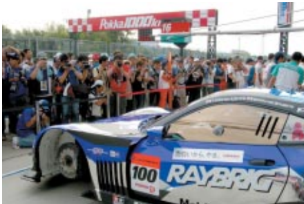
ピットウォークスタイルで開催された公開車検「オープンピット」