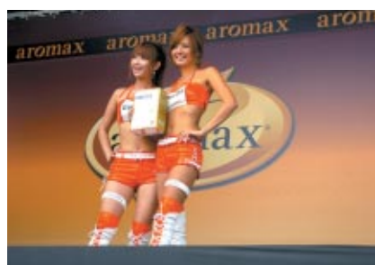
各チームのキャンペンガールが一堂に会した「スポンサーステージ」