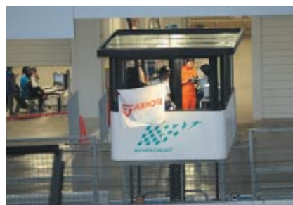
ファイナルラップに提示されたポッカフラッグ