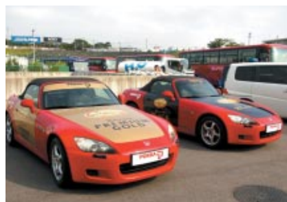
ポッカカラーのHonda S2000マーシャルカー