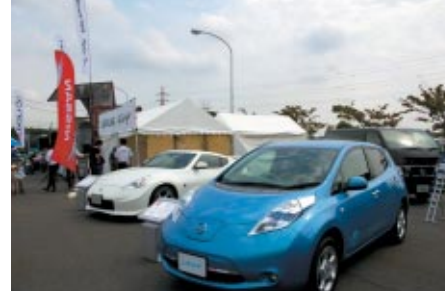
日産自動車のニューモデル群