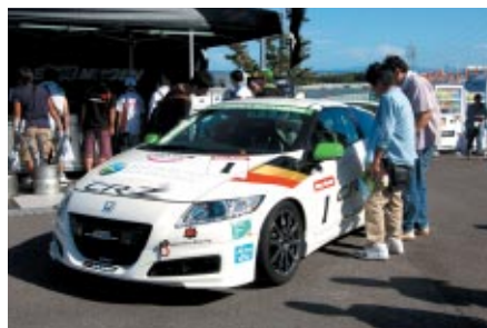
「Honda スポーツ&エコ プログラム CR-Z 1.0リッターチャレンジ」用 マシンが展示されたM-TECブース