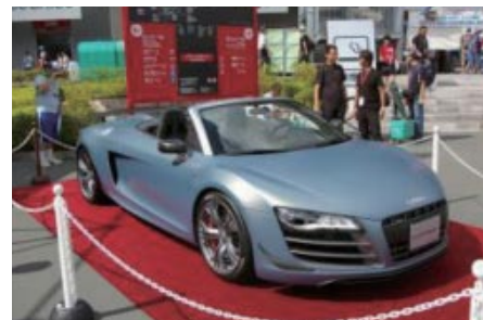
Audi R8 GT Spyder (Pokka 1000kmのレース参戦車のベース車両)