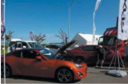
話題の86をはじめとしたラインナップはTOYOTAブース