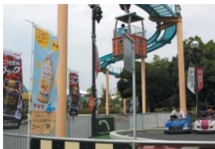
ゆうえんち「プッチグランプリ」では、ミニ耐久レース「インターナショナル プッチ ポッカ1000m」が開催されました