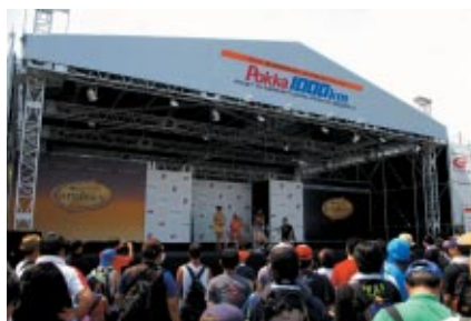
GPスクエアに設置された「ポッカ1000kmオフィシャルステージ」大会期間の二日間にわたって多彩なイベントが展開されました