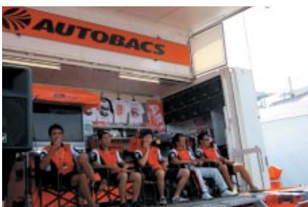
ARTA主要スタッフとドライバーが出演してトークショーが行われた オートバックスブース