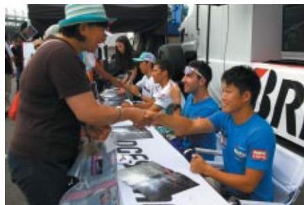
契約ドライバーのサイン会が行われたブリヂストンブース