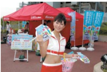
NTTドコモブースではオリジナルキャラクター「ドコモダケ」が あしらわれたうちわがサンプリングされました