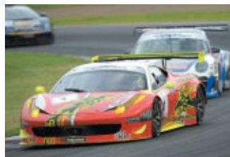
GT ASIA 第7戦 MOK Weng Sun(Ferrari F458 GT3)