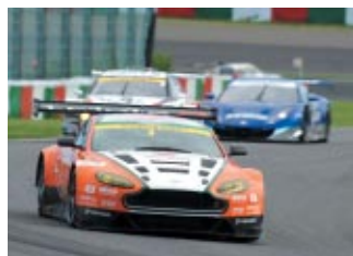
GT300クラス優勝 triple a vantageGT3