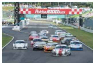
GT ASIA 第8戦 LI Zhi Cong(Porsche 997 GT3 R)