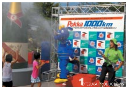
レーシングシアター前広場で行われた「コチラレーシングプレゼンツ びしょぬれWINNERS PHOTO TIME」巨大ジャンパンキャンホンで涼をご体験いただきました