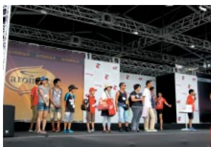
お客さま参加によるゲームでお楽しみいただきました