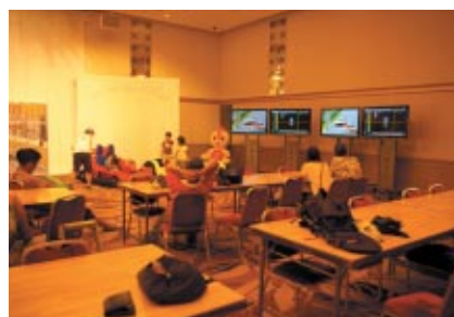
園内レストラン「S-PLAZA」内に設けられた「クールダウンエリア」レース観戦とお食事を空調の効いた室内でお楽しみいただけます