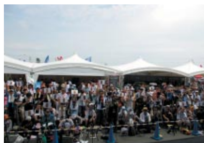
「ポッカ1000kmオフィシャルステージ」でのクイズ大会にご参加いただいたお客さま