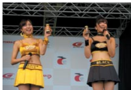
ポッカギャルによるポッカ製品のPRタイム