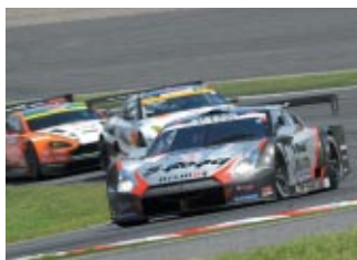
GT500クラス優勝 S Road REITO MOLA GT-R