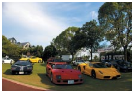
ホテルエリアでは、スーパーカー（フェラーリ・エンツォ、ランボルギーニ・カウンタック、フォード・GT40など）の展示とエンジンサウンドをお楽しみいただきました