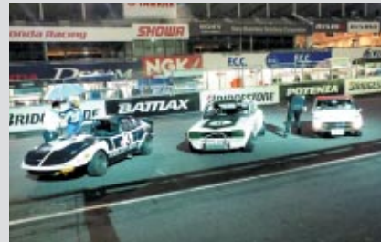
鈴鹿1000kmの歴史を飾ったマシン、ニッサンフェアレディZ、スカイラインGT-R、Honda S800 (左から)