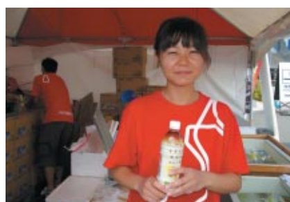
笑顔満開のポッカ製品販売ブーススタッフ