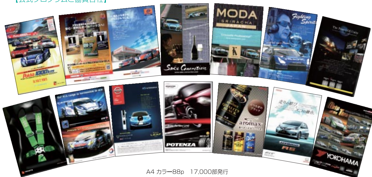
A4 カラー88p 17,000部発行