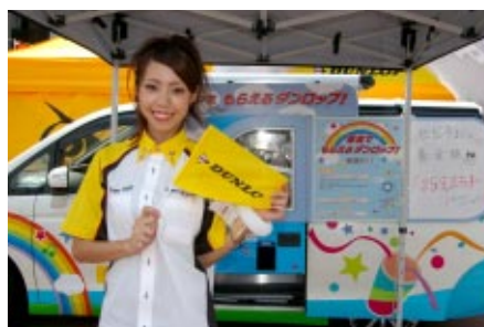
チャリティ募金を行っていただいたお客さまにオリジナルグッズを プレゼントしたダンロップブース