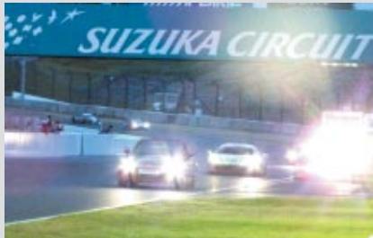
オープニングを飾ったGT ASIA参加マシンによるパレードラン

8月18日(土)の公式予選日夜には1000kmレース復活を記念して「ポッカ1000km復活祭」が開催されました。