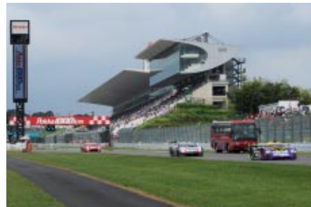
SUPER GTマシンが疾走するコースをバスで遊覧する「サーキットサファリ」 プレミアムエリアをご利用のお客さまの中から抽選でお楽しみいただきました