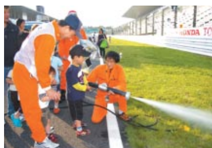
こちらは消火車での放水体験 気持ちよさそうです