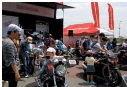
ニューモデルバイクの搭乗体験や 昨年の8耐優勝マシンが展示されたHondaブース