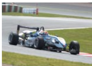
全日本F3選手権 第1戦 Cクラス 山内英輝 Nクラス 野尻智紀