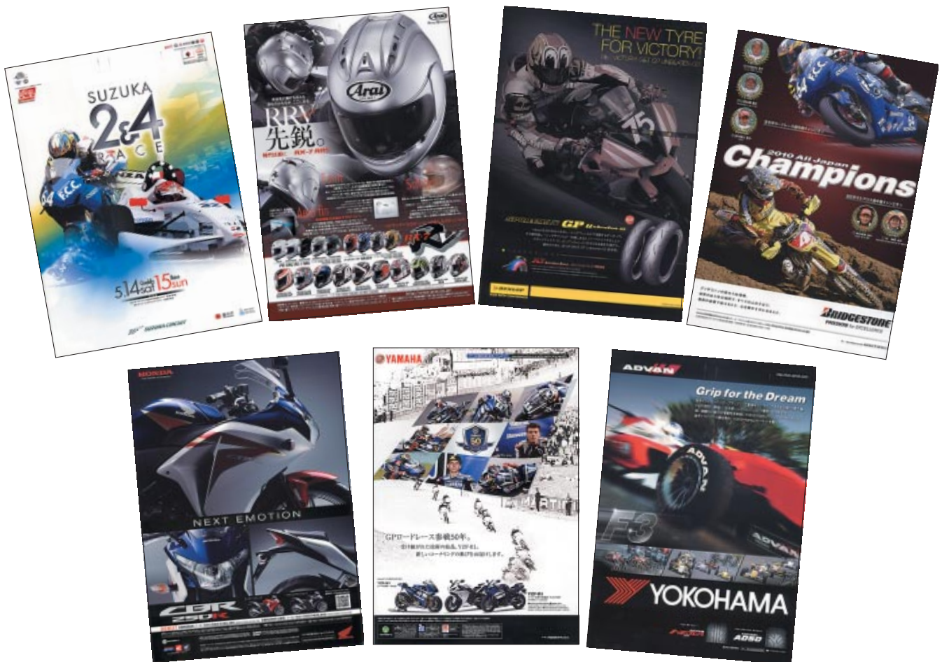
A4 カラー64p 12,000部発行

株式会社アライヘルメット 株式会社アイデア 株式会社NTTドコモ 株式会社三栄書房