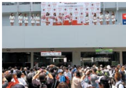
ピットウォーク中にボディウム(表彰台)で行われた 鈴鹿サーキットクイーン交替式