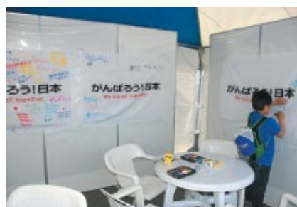
GPスクエアでの東日本大震災被災者へのメッセージフラッグ あたたかい応援メッセージが続々と書き込まれていました