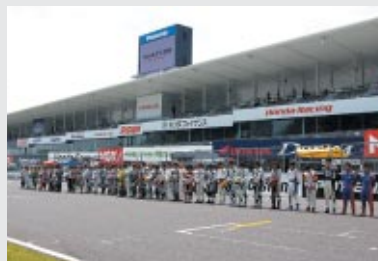
コース上に各選手が整列して行われた黙とう

*本大会でお預かりした義援金は「東日本大震災支援モータースポーツ義援金募集」から日本赤十字社を通じて被災地へ全額寄付させていただきます。