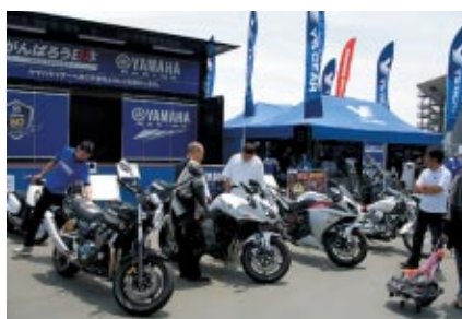
ニューモデルバイクが展示されたYAMAHAファンブース