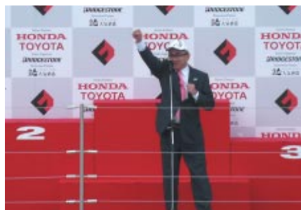
溝畑宏 観光庁長官の「Start Your Engines!!」で 各マシンのエンジンが始動したフォーミュラ・ニッポン決勝レース