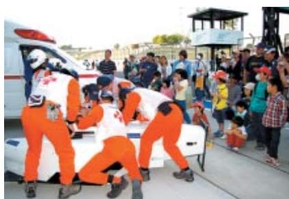
フォーミュラ・ニッポンのモノコックを使っの ドライバー救出訓練をピットウォークで公開