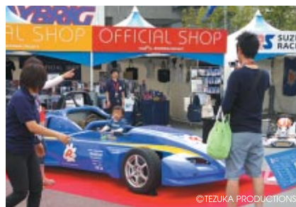
レーシングマシンへの搭乗体験が人気を呼んでいた コチラレーシングブース