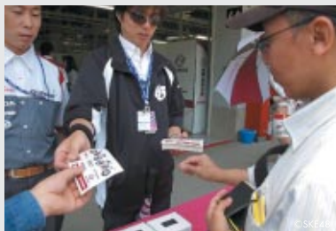
ピットウォーク時に各選手・チーム関係者が募金を呼びかけました