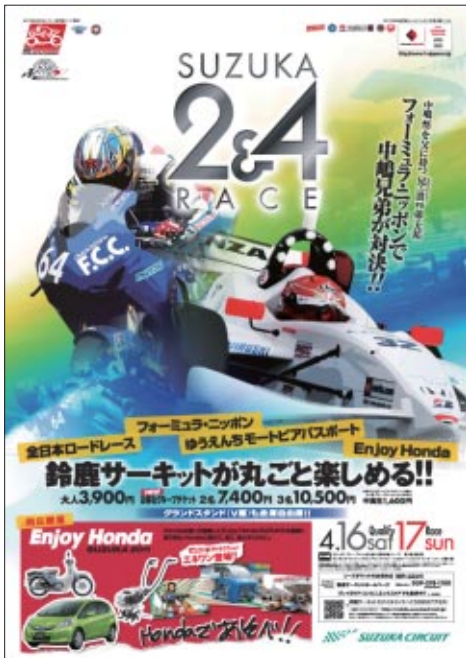
公式B2ポスター ※開催日表記は延期前のものです。