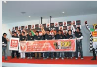
恒例の「バイクであいたい(リード)」を主催していただく 鈴鹿商工会議所青年部のみなさん