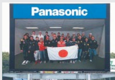
F1ドライバー全選手から応援メッセージをいただき、 サーキットビジョンで放映しました

財団法人日本モーターサイクルスポーツ協会 (MFJ)、株式 会社日本レースプロモーション (JRP)、日本F3協会、各カテ ゴリーの選手、チームの皆さんの協力のもと東日本大震災で 被災された方々へのチャリティー活動を実施しました。