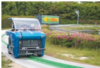
鈴鹿サーキットに今春搭乗した「ene-1 (エネワン)」 限られたエネルギーでどこまで走れるかを競うのりものです 家族で協力しながらチャレンジできます