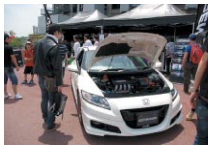
無限パーツを装着したHonda CR-Zに注目が集まった M-TECブース