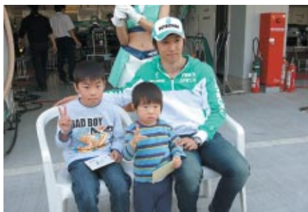
中学生以下ご同伴のお客様に無料でお楽しみいただいた 「キッズピットウォーク」