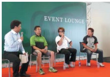
ライダートークショー (ピットビル2Fホスピタリティラウンジ)