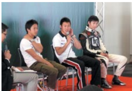
ドライバートークショー (ピットビル2Fホスピタリティラウンジ)