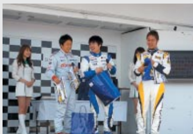
2輪・4輪選手のご協力により実施した チャリティーオークション(GPステッカー)

財団法人日本モーターサイクルスポーツ協会 (MFJ)、株式 会社日本レースプロモーション (JRP)、日本F3協会、各カテ ゴリーの選手、チームの皆さんの協力のもと東日本大震災で 被災された方々へのチャリティー活動を実施しました。