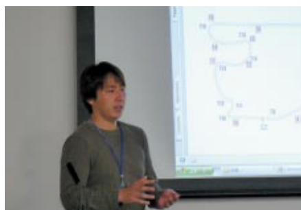
2007・2008フォーミュラ・ニッポンチャンピオン松田次生選手 によるコアな解説でファンに楽しんでいただいた 「フォーミュラ・ニッポンアカデミー」(ピットビル2Fフリーフィングルーム)