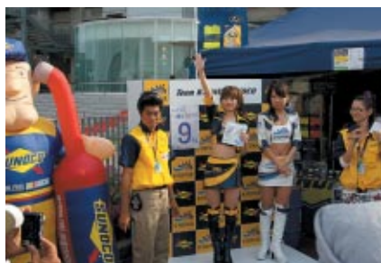
SUNOCOブースでは「石浦宏明選手の2周目の順位」を 的中させた方にグッズをプレゼント