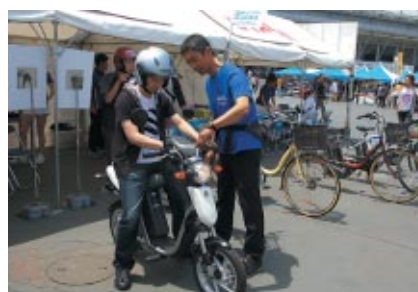
YAMAHAブースで行われた電動バイク「EC-03」と 電動アシスト自転車「PAS」体感試乗会