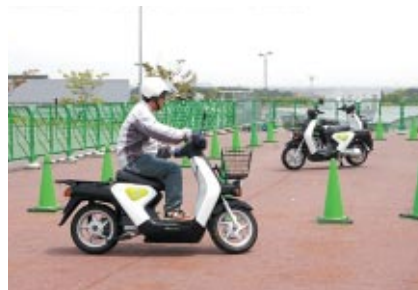
Hondaブース横で行われた電動バイク「EV-neo」体験試乗会