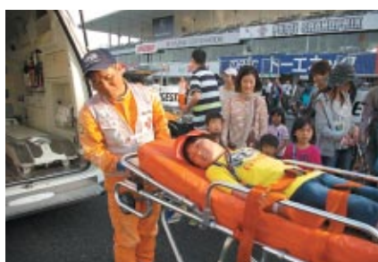
事故? ご安心ください キッズピットウォークで行われた "レスキューされる体験"のひとつ