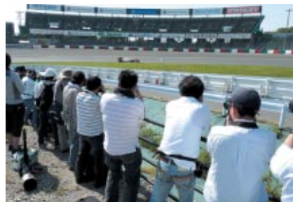
パドックへ入れるバスをお持ちのお客さまにお楽しみいただいた 「激感エリア」(写真は第2コーナーイン側)