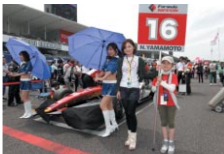
コチラレーシングファンクラブの皆さまに グリッドキッズをつとめていただきました