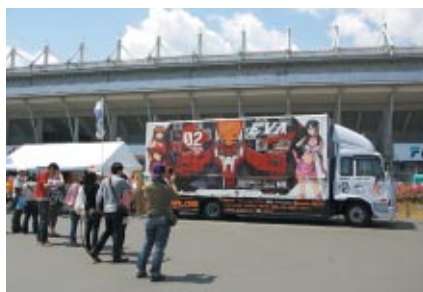
エヴァンゲリオンブースに置かれたADトラックは フォトコーナーとして大人気