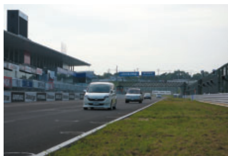
全レース終了後にレーシングコース体験走行をお楽しみいただいた 「マイカーラン」