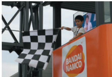
「キッズピットウォーク」ではチェッカーフラッグ体験も実施しました