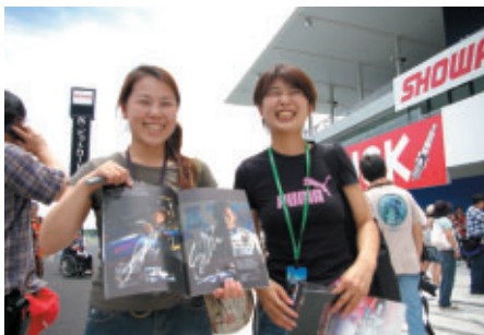
大阪と東京からお越しのお客さま 「鈴鹿サーキットで知りあって、ビッグレースでは毎回会っています」