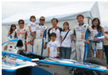
ローソンプースで行われたチームインバウンドドライバー3選手との記念写真