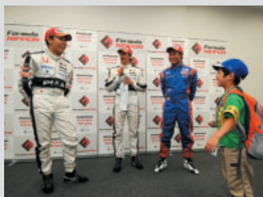
フォーミュラ・ニッポンドライバーに直撃取材! 子ども記者体験

これを記念して「コチラの!!みんなの!!30の夢プロジェクト」と題して、コチラのお誕生日の9月23日(水・祝)まで楽しいイベントが開催されています。