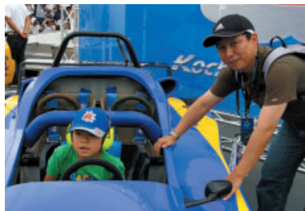
千葉からお越しのお客さま 「泊まりがけで予選・決勝を楽しんでいます」