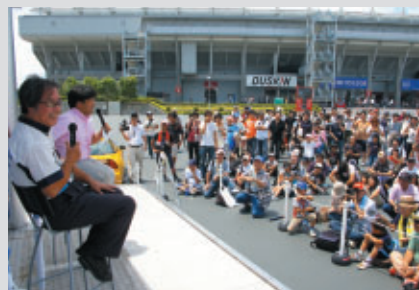
鈴鹿周辺5市1町の小中高生をご招待 スペシャルイベントとして星野一義監督のトークショーが 行われました