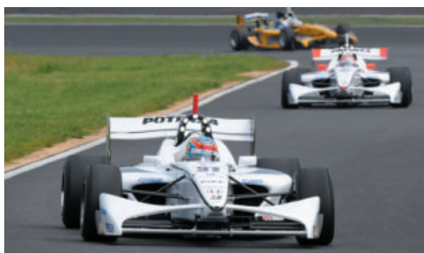
波乱の展開となったフォーミュラ・ニッポン第5戦