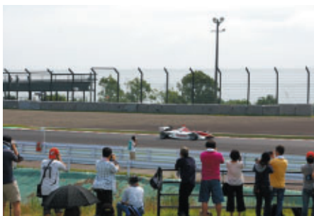
パドック入場可能なバスをお持ちの方にお楽しみいただいた 「激感エリア」(写真は2コーナーイン側)