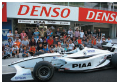
優勝したNAKAJIMA RACINGサポーターがデュバル選手&マシンとピット前で記念撮影