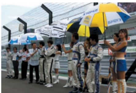
チーム別応援席「チームサポーターズシート」に 各チームの監督、選手が駆けつけ、ファンにメッセージを送りました