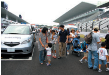
中学生以下のお子さまと保護者の方に無料で お楽しみいただいた「キッズピットウォーク」では 運営車が勢ぞろいしたコース上を開放しました