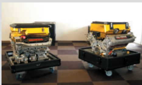
ピットビル2Fホスピタリティラウンジに展示されたニューエンジン 左 Honda HR09E 右 TOYOTA RV8K