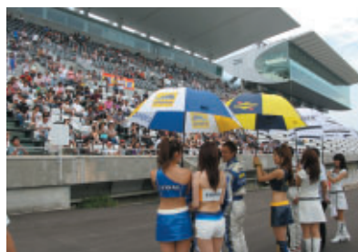
決勝スタート前にグランドスタンドで選手・監督がごあいさつ