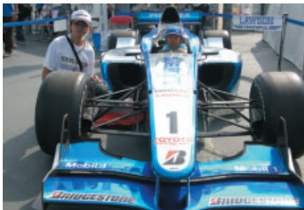
ローソンプースでお買い物をされたお客さまを対象に実施された'08チャンピオンマシンコックピット体験