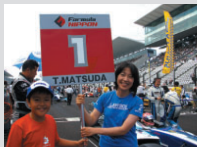
スタートティンググリッドをエスコートした 「グリッドキッズ」