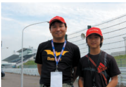
名古屋からお越しのお客さまは ホームストレート横の「激感エリア」でご観戦中でした