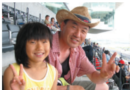
周辺5市1町の生徒ご招待でお越しのお客さまは隣の四日市市から 「娘にレースを生で楽しんでもらおうと思って… 次は2歳の息子を連れてこようと思います」