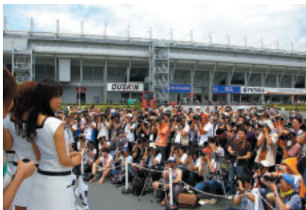
GPスクエア特設ステージで行われたレースクインフォトセッション