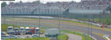
今回お披露目となったQ2席 コースの多くを見渡せる眺望のよさが大好評でした