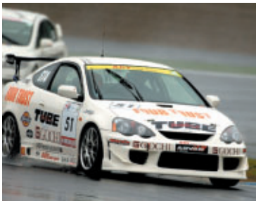
STクラス4 TUBE FOUR TRUST GOCHI