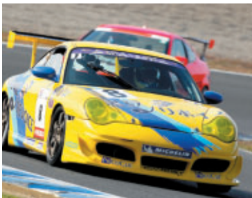
ST1クラス 黒豆リボイス GT3