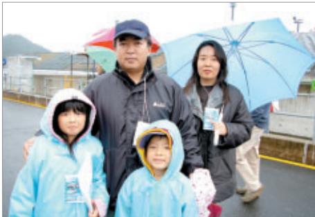
10日(土)にピットウォークを楽しんでいた埼玉のご家族