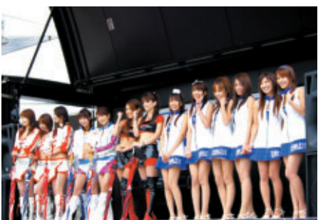
スーパー耐久ステージで華やかに開催された「キャンペーンガールオンステージ」