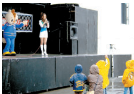
スーパー耐久ステージでツインリンクもてぎエンジェルとコチラちゃんがちびっこたちと「ジェスチャーゲーム」を実施