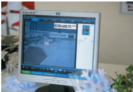
モバイルPC、PDA、スマートフォンでレース映像・順位が お楽しみいただけるPit Live TV powered by Planex