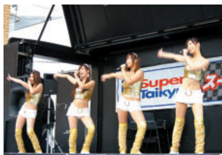
スーパー耐久ステージで行われたスーパー耐久シリーズイメージガール「Vanilla」のミニライブ