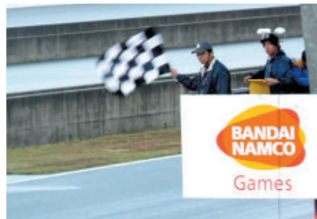
抽選で選ばれたお客さまが 栄光のチェッカーフラッグを振りおろしました