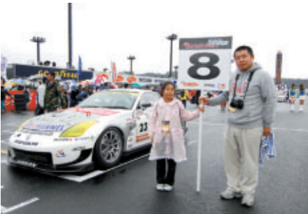
とちぎテレビ主催「キッズ1日体験ツアー」では 参加9組がグリッドを体験しました