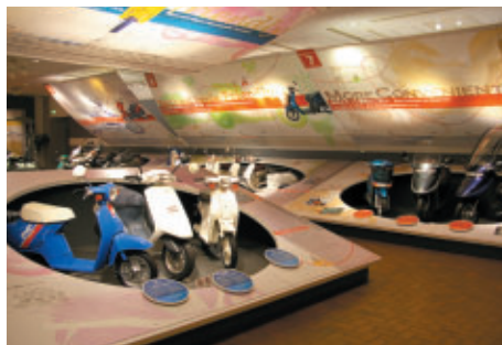
Honda Collection Hallでは 特別展示「スクーター立体図鑑」を開催中(1/20まで)