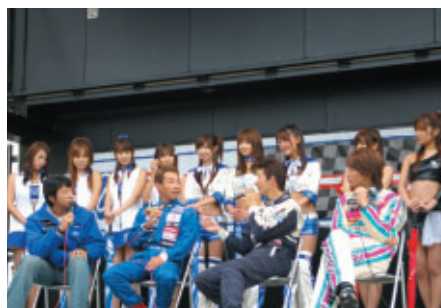
スーパー耐久ステージで行われた「Car Xドライブトークショー」