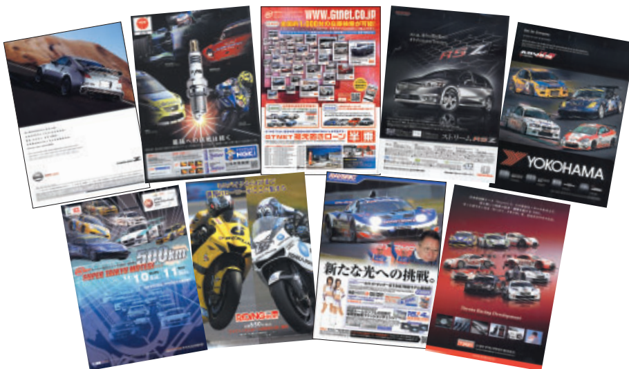
GTNET 株式会社 スタンレー電気 株式会社 トヨタテクノクラフト 株式会社 日産自動車 株式会社 日本特殊陶業 株式会社 株式会社 ニューズ出版 本田技研工業 株式会社 横浜ゴム 株式会社