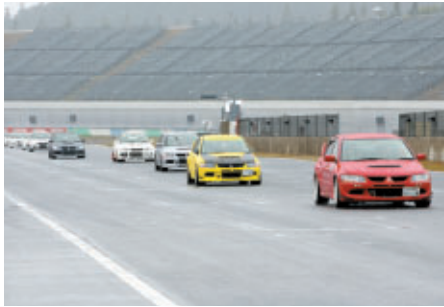
ランサーエボリューション オーナーズパレード