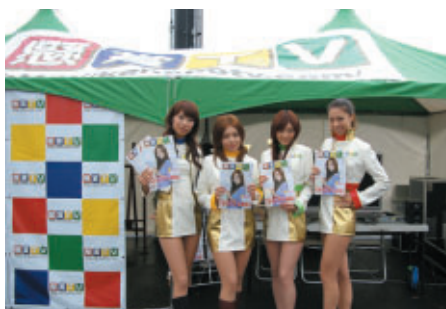
懸賞専門チャンネル「懸賞TV」のPRブース