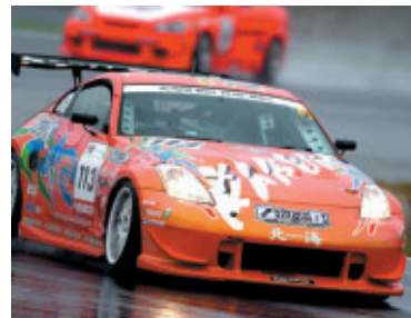
ST3クラス カルラレーシング☆ings北海Z