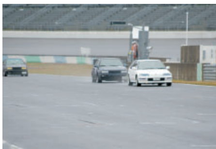
10日(土)に行われたタイム計測付きの走行会「Enjoy Attack Run」