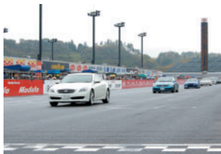
栃木県在住の日産車オーナーによる「日産プリンスバレーードラン」