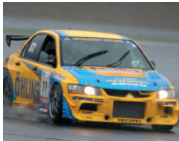
ST2クラス オーリンズ・ランサーEVO・MR