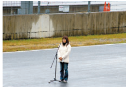
抽選で選ばれたお客さまによるスタートコール 「Gentlemen, Start Your Engines!」