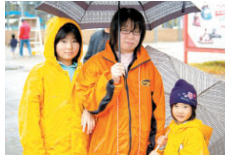
茨城からお越しのご家族 ジャケットはドライバーのサインでいっぱい!