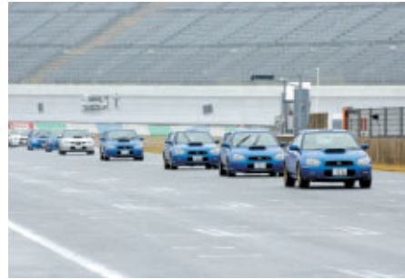
インプレッサ オーナーズパレード