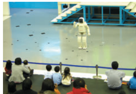
ファンファンラボで行われた新型ASIMOデモンストレーション