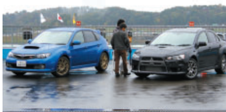
グランドスタンドプラザに展示されたスバル・インプレッサ WRX STI(左)とランサーエボリューションX