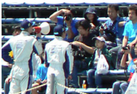
おなじみのチーム別応援席「チームサポーターズシート」をドライバー・監督らが訪問