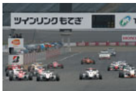
全日本F3選手権第5戦 スタートシーン