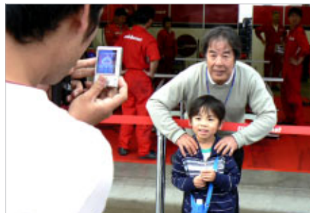
中学生以下のお子さま同伴は無料の「KIDSウォーク」 星野監督もニコニコ