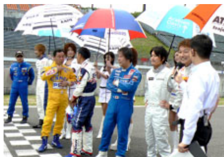
往年の名ドライバーらによるエキシビション 「マスターズ・オブ・フォーミュラ」左から森本晃生、服部尚貴、中嶋悟、木下正治、星野一義、近藤真彦、金石勝智の各氏