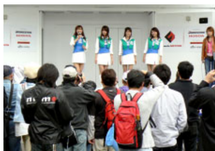
フォーミュラ・ニッポンステージで行なわれた ツインリンクもてぎエンジェルPRタイム