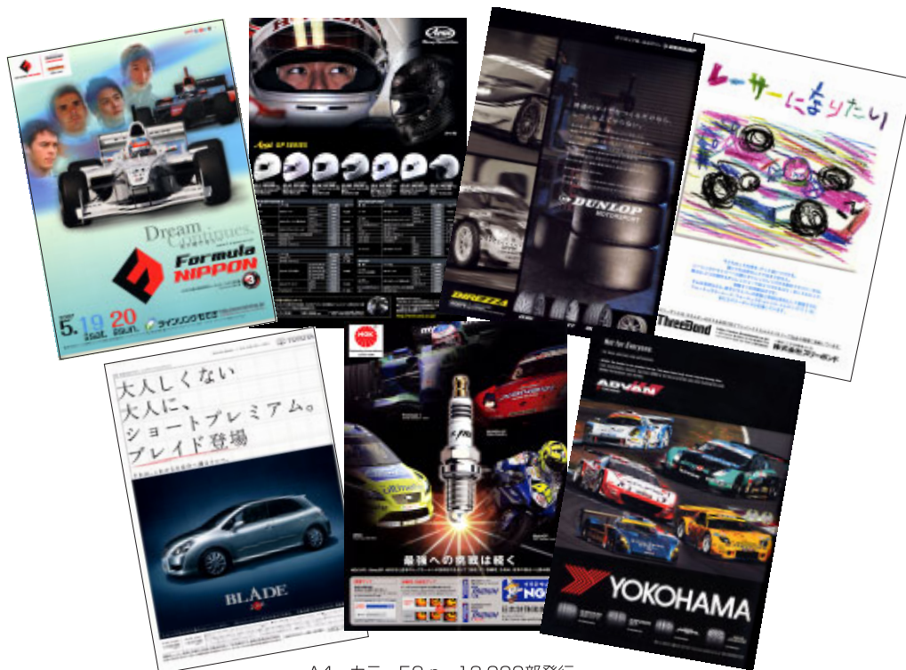
A4 カラー52p 13,000部発行

株式会社 アライヘルメット 株式会社 アイデア 株式会社 オートボックスセブン 株式会社 三栄書房 株式会社 三推社