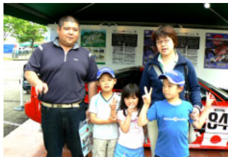
千葉からお越しのご家族 土日通いでご観戦です