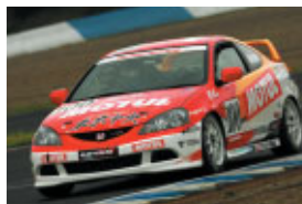
インテグラ 嶋村 馨