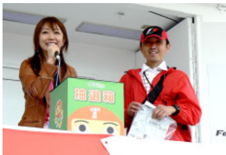
とちぎTVの大抽選会 2シーターフォーミュラ搭乗が大当たり