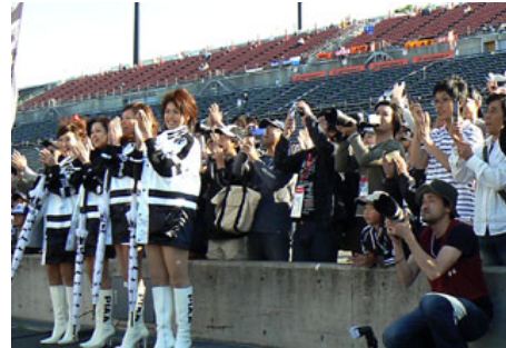
PIAA NAKAJIMAサポーターは表彰台最前列から祝福 応援のしがいがありました