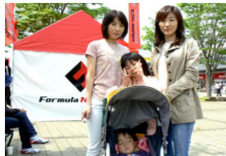
姉妹のお二人がそれぞれのお子さまとご主人は家で お留守番だそうです パドックバスで楽しまれていました