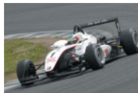
全日本F3選手権 第5戦 オリバー・ジャービス