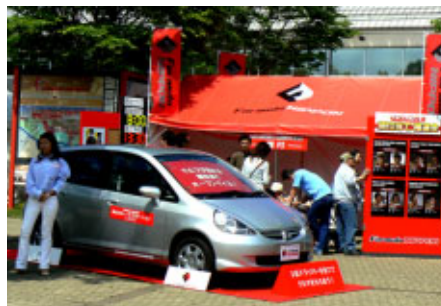
Honda Fitが当る「順位当てクイズ」 今回の3位は果たして誰?