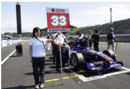
今回のグリッドスタッフはすべて栃木在住の方々にお願いしました