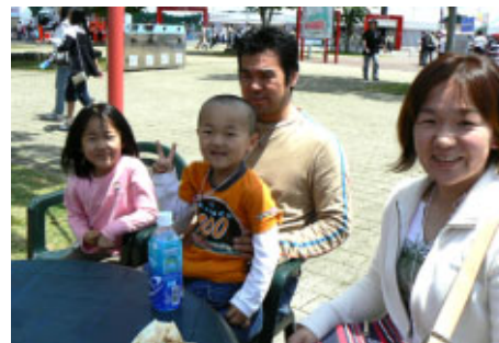
茨城県笠間市からお越しになりました 鈴鹿にも足を運ばれるそうです