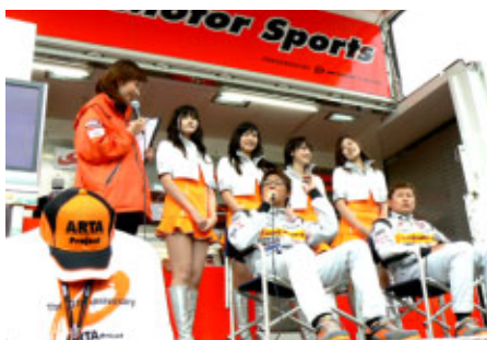
ARTAブースで行なわれたドライバートークショー