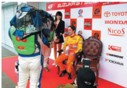
予選暫定1位が座れる「王様の椅子」