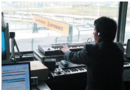
放送室ではシンセサイザーを駆使した実況&演出