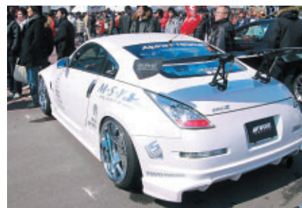
チューニングカーの展示・デモンも