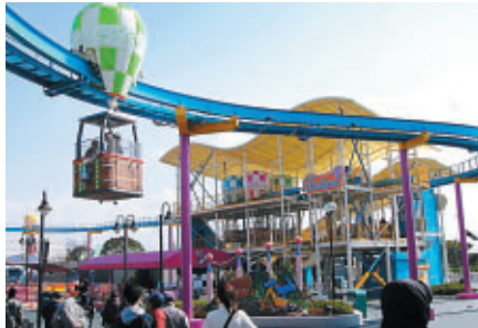
遊園地に新登場の「ルンルンバルーン」