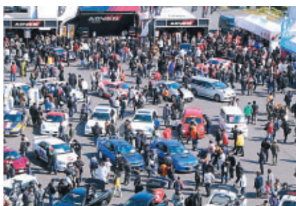
PRブースの拠点、グランプリスクエア