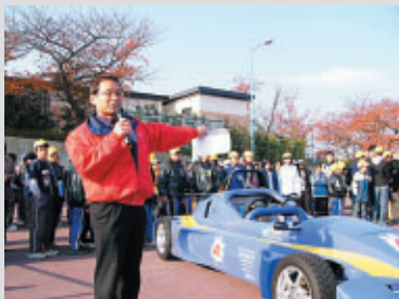
地元小学生にマシン解説 (FN最終戦)

「モータースポーツ都市宣言」を行なった鈴鹿市。モータースポーツを通じて明るく住みよい街づくりをめざし、またモータースポーツに親しんでもらおうと有志による活動が始まっています。