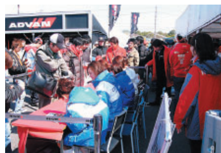
カルソニックギャルサイン会