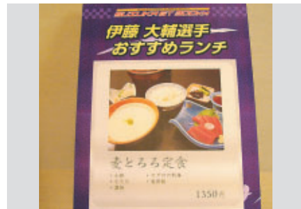
ポールポジションの原動力?