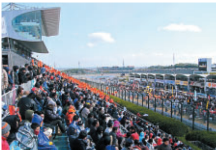
グランドスタンド