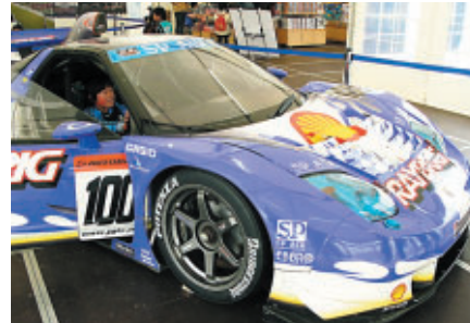
遊園地イベント「コチラのモビフェスタ」にて