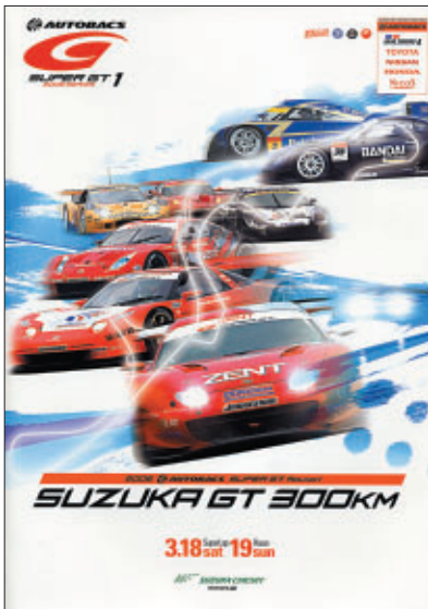
A4 カラー68p 16,000部発行

株式会社 アライヘルメット 日本特殊陶業 株式会社 株式会社 アイデア 株式会社 バンダイ 株式会社 ウィルコム PTCジャパン 株式会社 株式会社 オートボックスセブン 富士通テン 株式会社 カルソニックカンセイ 株式会社 株式会社 プリチストン 5ZIGENインターナショナル 株式会社 本田技研工業 株式会社 株式会社 三栄書房 株式会社 株式会社 三推社 ホンダダイレクトマーケティング スタンレー電気 株式会社 モーターマガジン社 タカタ 株式会社 横浜ゴム 株式会社 ダンロップファルケンタイヤ 株式会社 株式会社 ツインリンクもてぎ 株式会社 デンソー 株式会社 二玄社 日産自動車 株式会社 ニッサン・モータースポーツ・インターナショナル 株式会社