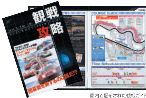
園内で配布された観戦ガイド