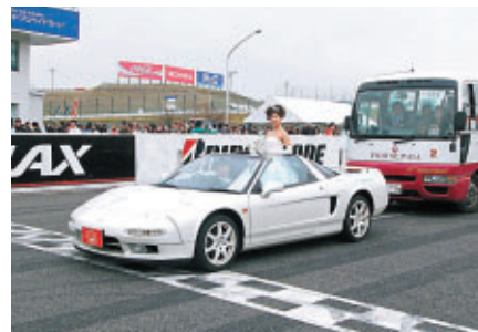
決勝日にはウェディングパレードが行なわれました