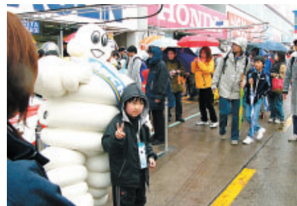
子供連れのお客様は無料の「キッズウォーク」