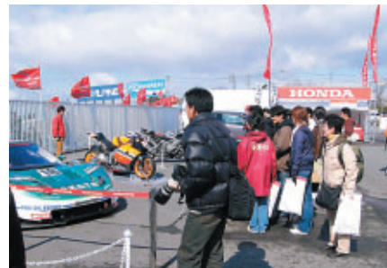
ホンダ製マシンを応援席入口に展示