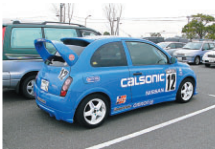
レースエントラントではありません