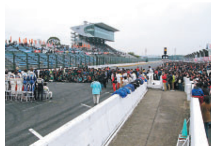
選手集合写真にはビットウォーク中のお客様も殺到