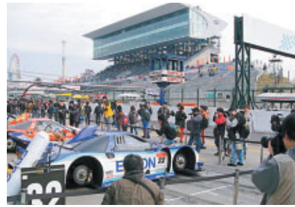
大会は土曜朝の公開車検からスタート