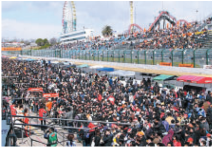
決勝前のピットウォーク