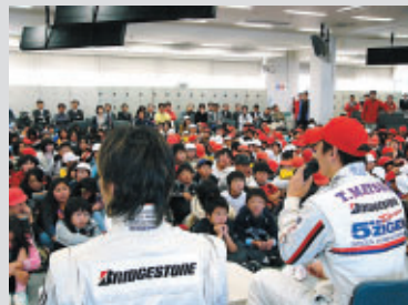
地元出身選手のトーク (FN最終戦)