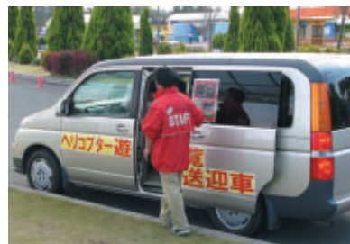
「ヘリコプター遊覧飛行」では南ヘリポートまで ステップワゴンで送迎