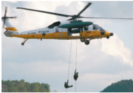
航空自衛隊百里基地所属の救難救助ヘリコプターUH-60J による航空救難デモンストレーション