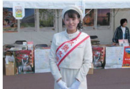
茨城県のブースでは、ミス奥久慈がブースをPR