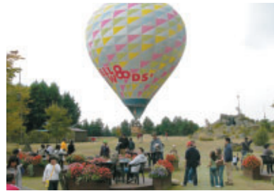
紅葉し始めた周辺の山々を見下ろすことができる ハローウッズでの熱気球体験搭乗