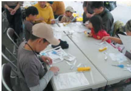
日本航空協会により、こども紙模型飛行機工作教室 (各回20名限定)を開催 また、スカイスポーツのPRを実施