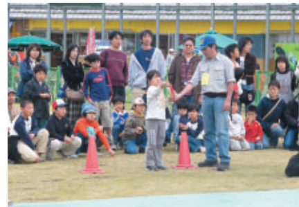
模擬滑走路に模型飛行機を飛ばして滑空距離を競う 滑空コンテストも実施 距離に応じて賞品をプレゼント!