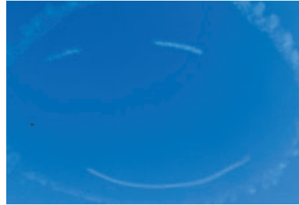
空一面がパイロットにとってのキャンパス スマイルマークが青空に映えます