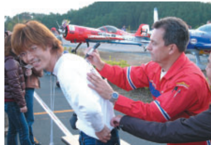
中には着ている衣服にサインをもらう強者も…