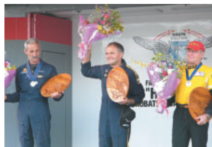
表彰式では、大勢のお客様が素晴らしい技を披露してくれたパイロット達を祝福しました