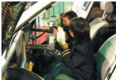
ファンファンラボでは、6人乗り実験用小型ジェット機 「MH-02」にパイロットのコスチュームでパイロット体験