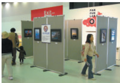
ファンファンラボの写真展「Horusに愛されし者達」 ※徳永カメラマンの写真教室