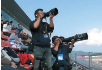
カメラマンシートではプロ顔負けの装備!