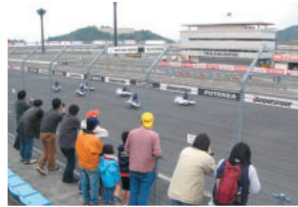
BRIDGESTONE INDY™ JAPAN 300mileでのオープニング セレモニーでも登場した「ブルーインパルスJr.」が華麗なテクニックを披露