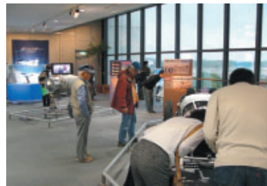
Honda Collection Hallでは特別企画展 「限りなき夢へ……～44年の時を経て～」が開催