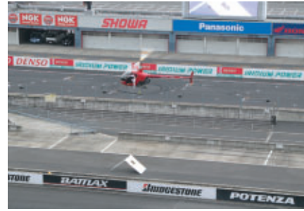
公式競技とはひと味違ったアルファフライトチームによる ヘリコプターでのデモンストレーションフライト