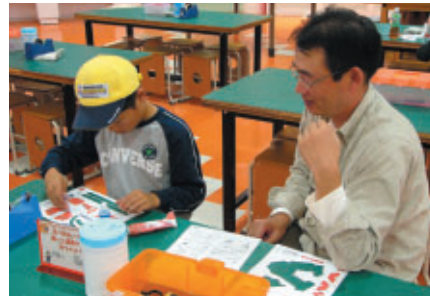
ファンファンラボドリームスタジオでは、期間中オートボルテージスベシヤルパークラフトも登場