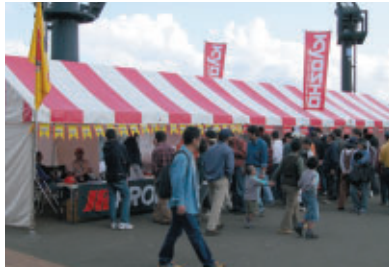
グランドスタンドプラザにはラジコンメーカー特設ブースを設置