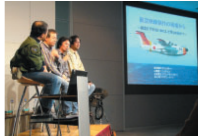
航空映像製作スタッフによるワークショップ ～航空映像製作の現場から～