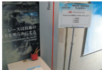
3つの場所にあるクイズに全問正解するとオリジナルグッズがもらえるクイズラリーも実施