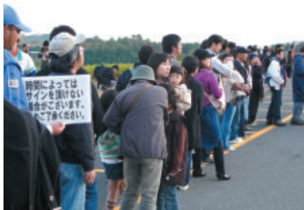
「フライトガーデンオープン」では パイロットのサインをもらうのに長蛇の列が