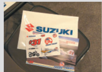
ワークショップ参加者には、オリジナルステッカーを配布スズキのPRブースでも同様のものが配られました