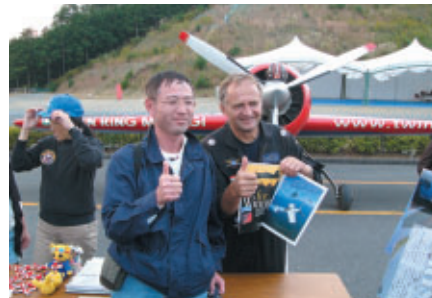
お気に入りのパイロットと記念撮影 パイロットと身近にふれあうことができます