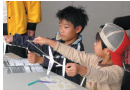
本格的紙飛行機「White wings」製の紙飛行機キットを使用した 紙飛行機教室がグラウンドスタンドプラザ特設エリアで開催