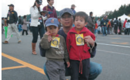
「フライトガーデンオープン」は各日1,000人限定 両日とも大盛況につき完売でした