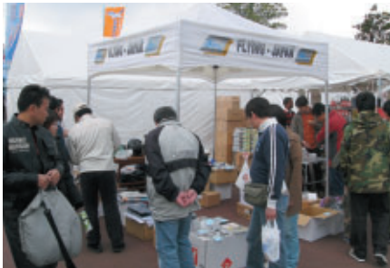
航空機の関連グッズを扱う航空機グッズブースでは、普段お目にかかれない掘り出し物が?!