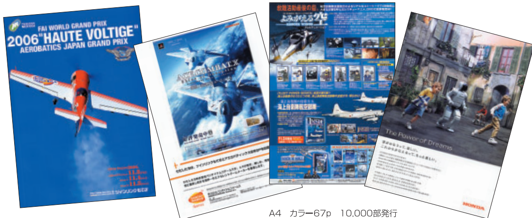
A4 カラー67p 10,000部発行