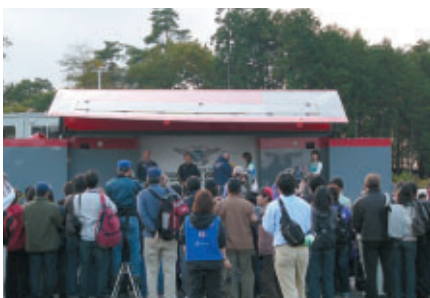
5日(日)のフライトガーデンオープンでは表彰式を実施