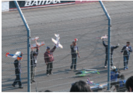
実機同様の曲技飛行を披露した ラジコン飛行機・ヘリコプターのデモンストレーションフライト

大会期間中には、アエロバティックスの競技そのものはもちろんのこと、会場内の様々な場所で航空機に関連するイベントが行われ、子供から大人まで幅広い年齢層のお客様が楽しめました。