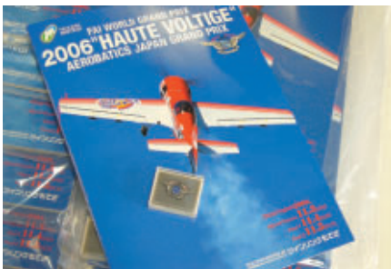
VIPテラスで御観覧のお客様には、プログラムの他にオリジナルピンズを記念品として配布