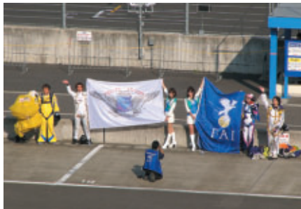
スカイダイビング展示降下では、 着地後にフラッグを広げ競技開始をアピール