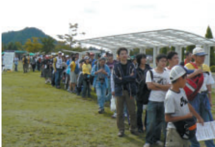
MotoGPライダーサイン会抽選にはご覧のとおり長蛇の列