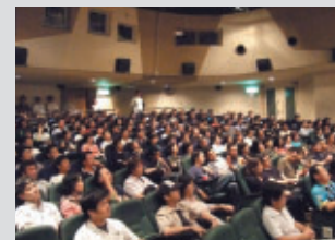
9月16日(土) テアトル新宿(東京)での『Turn8』公開初日イベント