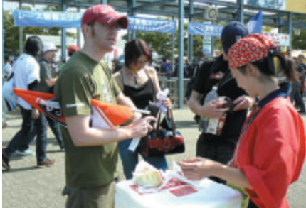
餃子の魅力を海外からのお客さまに解説中