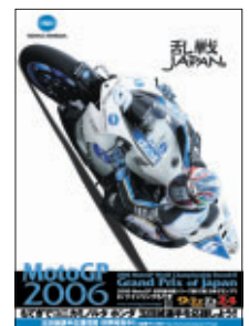
KONICA MINOLTA Honda