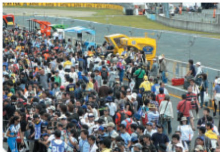
ピットウォークは各回とも満員御礼