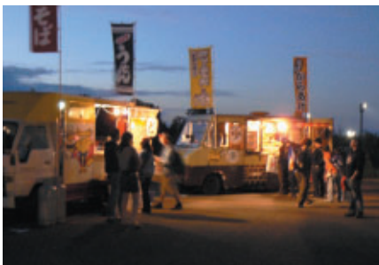
「ステイエリア」のすぐ近くには飲食コーナー「デリデリナイトガーデン」もオープン