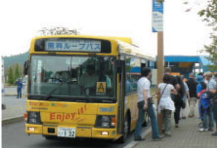
広い場内を快適に移動できる無料ループバス

年に一度のMotoGP。全国から訪れる多くのお客さまに、より快適にお過ごしいただけるよう、さまざまな施策を実施いたしました。