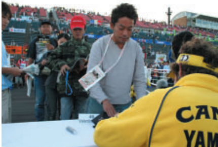
抽選で600名様にMotoGPライダーサイン会を スーパースピードウェイコース上で実施(23日)