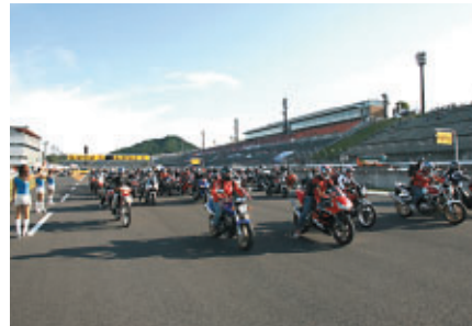
熱戦の余韻冷めやらぬロードコースを愛車で体験走行 (ファイナーレパレード)