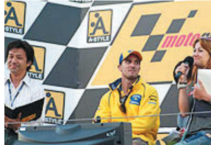
上映会のプレスステージにはC.エドワーズ選手も 登場して大いに盛り上がりました(23日)