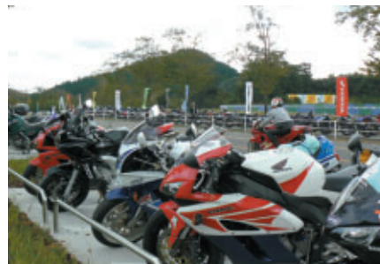
中央エントランス近くに新設された二輪専用駐車場