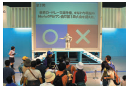
ASIMOがGPIにちなんだクイズを出題 正解者にはGPライダーサイン入りグッズをプレゼント