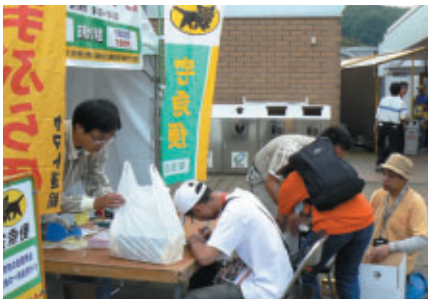
ヤマト便の荷物預かりと全国配送