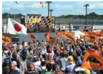
KTMフラッグと日の丸が舞うGP250表彰式