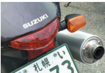
北からも… 南からも… 年に一度の日本グランプリには、全国各地から MotoGPファンが観戦に訪れました