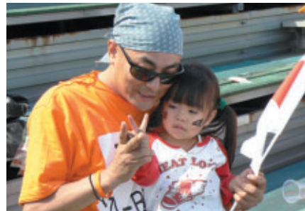
こちらはお父さんの熱気に押され気味?