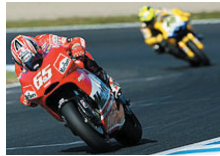
バレンティーノ・ロッシの追撃を振り切り 2年連続で独走優勝を果たしたロリス・カピロッシ

メインのMotoGPクラスは、ポールポジションからスタートしたロリス・カピロッシ (DUCATI) が、バレンティーノ・ロッシ (YAMAHA) をふり切り快勝。GP250クラスは青山博一、GP125クラスはミカ・カリオのKTM勢が、いずれも息づまる接戦を制して表彰台の中央に立ち、全クラスのウィナーが昨年と同じ顔ぶれとなりました。