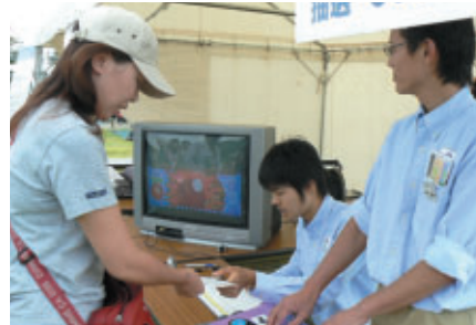
ボタンを押して…はい、当選!