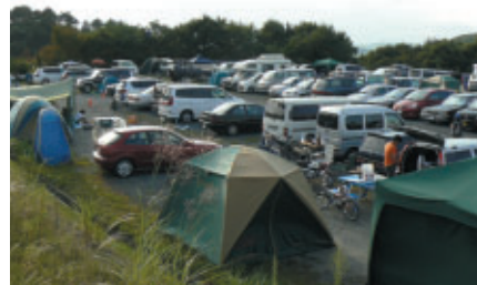
宿泊ができる駐車場、「ステイエリア」