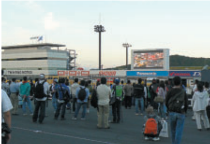
映画「FASTER」 「Turn8/ラグナセカの青い空:未公開映像」 プレミアム上映会を場内サーキットビジョンで実施(23日)