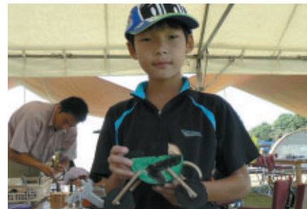
中央エントランスで開催された「森のクラフト」教室で ゼッケン56・ライムグリーンのバイクが完成!