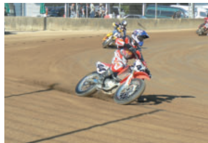
アメリカンモータースポーツの醍醐味を堪能 「ダートトラック2&4オールスターレース」を MotoGP決勝終了後に開催(24日)