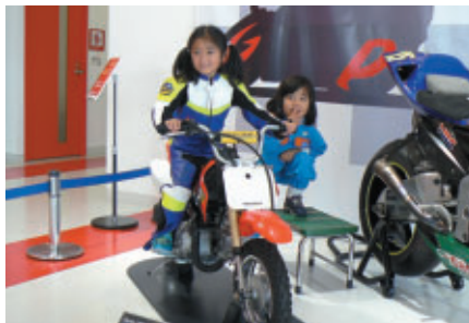
ライディングスーツを着て、はいチーズ!(ファンファンラボ)