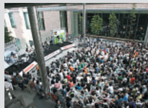
9月2日(土) 汐留・日本テレビ 大屋根会場での模様