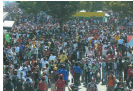
大勢のお客様で賑わうイベント&プロモーションの拠点 グランドスタンドプラザ