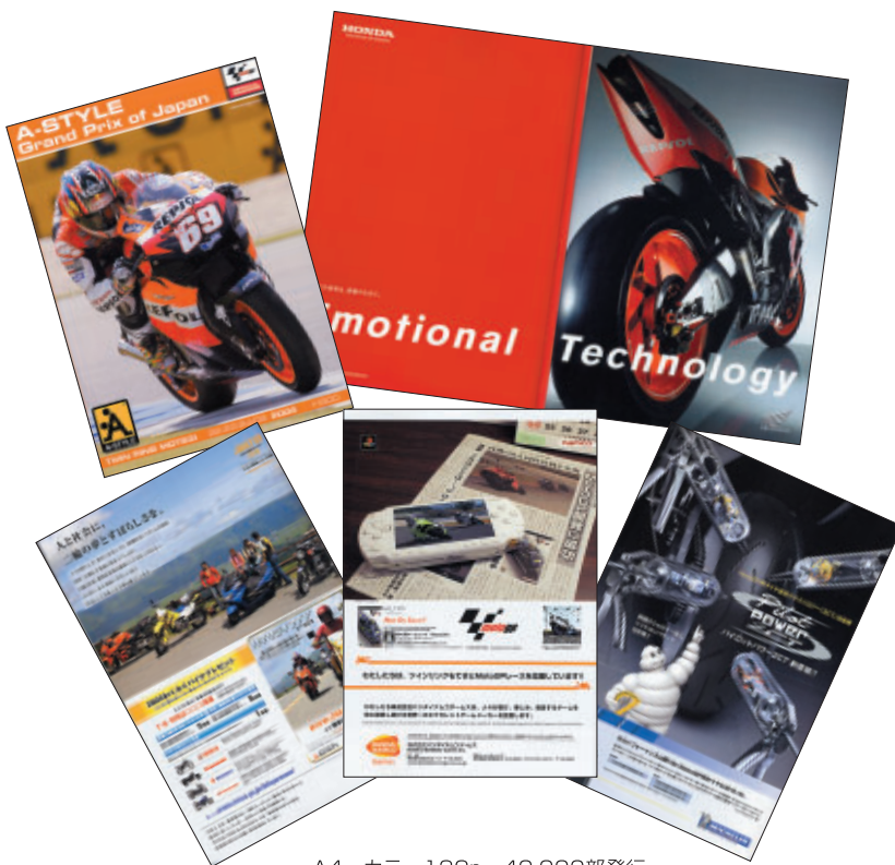
A4 カラー132p 40,000部発行