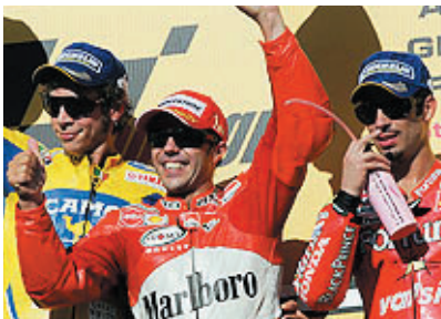
MotoGPクラスの表彰台はイタリアンライダーが独占