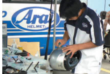
アライヘルメット、SHOEI各社様によるヘルメット無料メンテナンスサービス