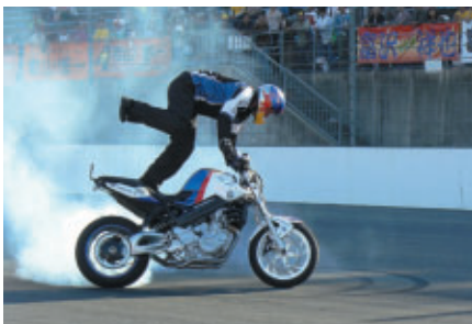
2004 スタント・ライディング・ヨーロッパ選手権チャンピオン、 クリス・ファイヤー選手がBMW F800Sを駆り、 エクストリームバイクのスーパーステックを披露(24日)