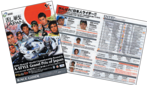
無料で配布された観戦ガイド