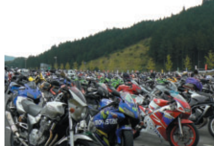
ダートトラックコース横 バイク専用駐車場