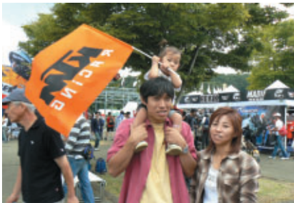
応援のしがいのある週末でしたね