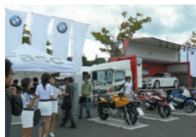
BMWブース (東エントランス)