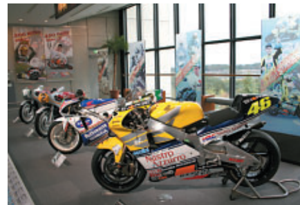
Honda Collection Hallでは 最高峰クラス200勝、GP250 クラス200勝を記念し、歴代のHonda GPマシンを特別展示