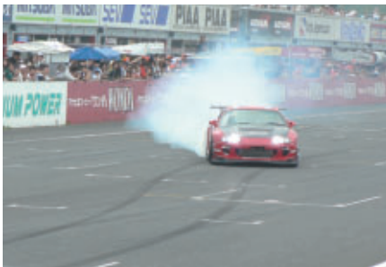
ピットウォーク中に行われたチューニングカーデモラン