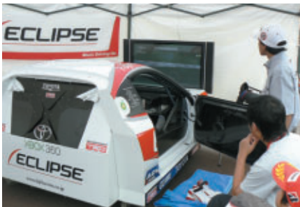
ECLIPSEブースの ドライビングシミュレーションゲーム体験コーナー