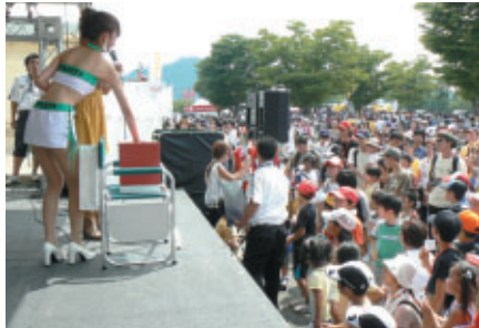
「KIDS抽選会」でレアものグッズをゲット!

SUPER GTでは、次代のモータースポーツファンやレーシングドライバー、メカニックなどの養成を主眼とした子供たちへのプログラムを展開しています。 今大会ご来場いただいたファミリーのみなさんは、もてぎならではの数々のアトラクションとあいまって、モータースポーツの魅力と楽しさを存分に楽しまれていました。