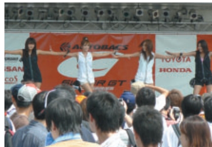
SUPER GTイメージガール「4☆tune」ミニライブ