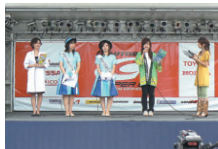
GTメンバーズステージで行われた茨城県PRタイム