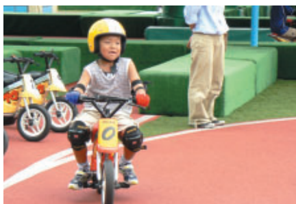
「ブッチタウン」では「キッズバイク」でライディング初体験