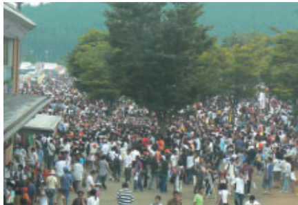
大勢のお客さまでにぎわうグラウンドスタンドプラザ