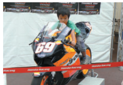
そしてMotoGPマシンにステップアップ?(Hondaブース)