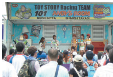
子どもたちに大人気のトイストーリーレーシングチーム PRブースはまんま「アンディの部屋」