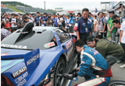
もてぎ恒例の「モータースポーツワークショップ」では、 一般のお客さまにチーム国光のピットワークをご体験いただきました