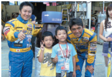
キッズウォークではあこがれの選手と触れ合える!