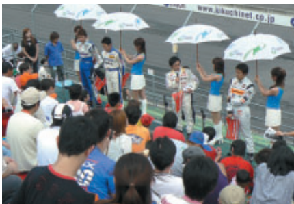
「Hondaファンシート」(C席)をNSXドライバーたちが訪問