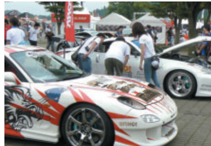
SUPER GT参戦チームが開発した チューニングカーを多数展示