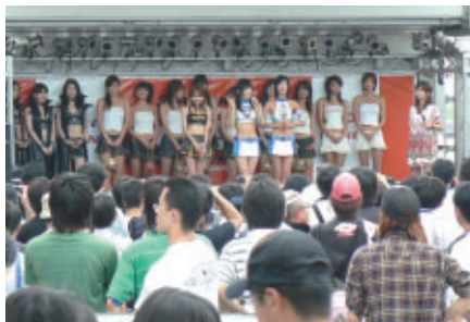
GTメンバーズステージで行われた「キャンギャルオンステージ」