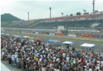
決勝日のピットウォーク スーパースピードウェイ側では キャンギャルオンステージの「ツインピットウォーク」