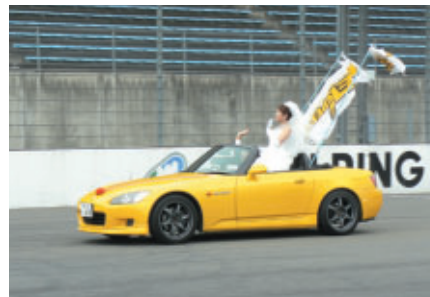
ウェディングパレード 新郎は四輪誌「REVスピード」編集部の方です