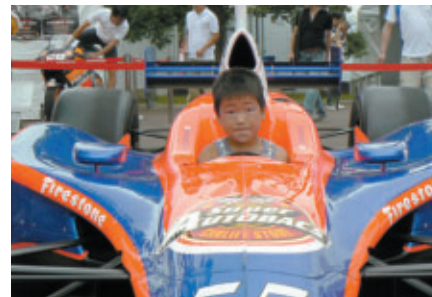
インディカーのcockpit体験(Hondaブース)