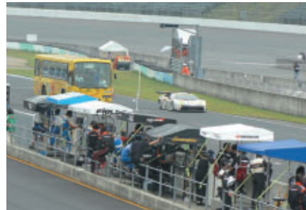
GTフリー走行にバスで迫力のコース体験 「サーキットサファリ」