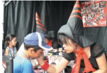
ADVANブースでフェイスペイントサービス