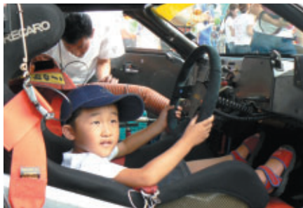
トイストーリーレーシングチームのcockpitを体験 (キッズウォーク)