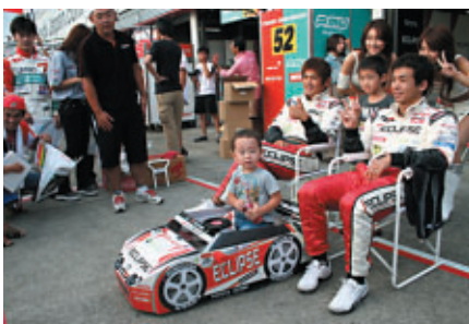
中学生以下のお子さまと保護者が 無料で楽しめる「キッズウォーク」