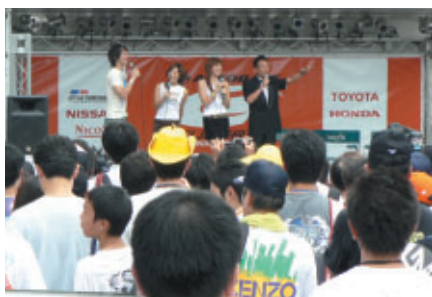
「激走! GT」公開収録の様様