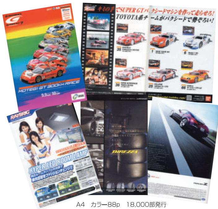
A4 カラー88p 18,000部発行

株式会社 ウィルコム エプソン販売 株式会社 NTN 株式会社 株式会社 オーテックジャパン 株式会社 オートボックスセブン カルソニックカンセイ 株式会社 京商 株式会社 スタンレー電気 株式会社 タカタ 株式会社 株式会社 ダブルユ・エフ・エヌ ダンロップファルケンタイヤ 株式会社 トヨタ自動車 株式会社 トヨタテクノクラフト 株式会社 日産自動車 株式会社 日本特殊陶業 株式会社 株式会社 バンダイ 株式会社 バンダイナムコゲームス 株式会社 フィリップス エレクトロニクス ジャパン 富士通テン 株式会社 株式会社 プリヂストン 本田技研工業 株式会社 株式会社 ホンダコムテック モータースポーツジャパン 組織委員会 横浜ゴム 株式会社