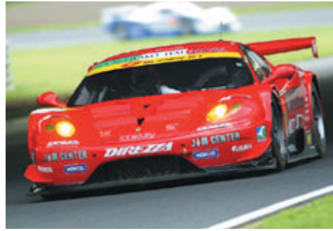
GT300クラス優勝 JIM CENTER FERRARI DUNLOP