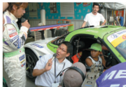
キッズウォーク中に行われた「モータースポーツワークショップ for Kids」 トイストーリーRTの協力で子供たちにGTマシンを解説