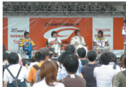
GTメンバーズステージで行われた GT300ドライバートークショー ウラ話や爆笑トーク満載!