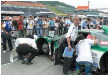
競技前のマシンチェック車検を ピットウォークスタイルで見られる「公開車検」