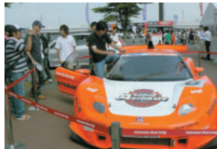
NSX GTマシンのコックピット体験(Hondaブース)