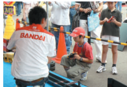
「バクシード」にはマシン造りの楽しさが…メカへの第一歩? (BANDAIブース)