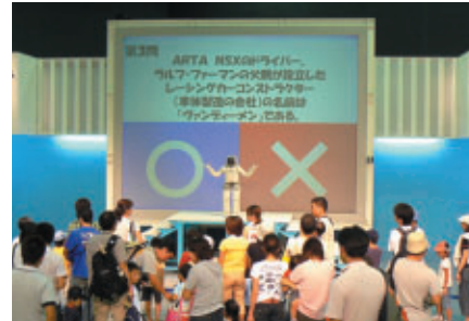
「アシモと遊ぼう! SUPER GT特別編」と題して SUPER GTにちなんだクイズ大会を実施(ファンファンラボ)